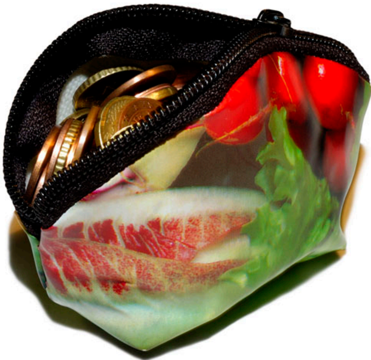
CAJA CHICA 1