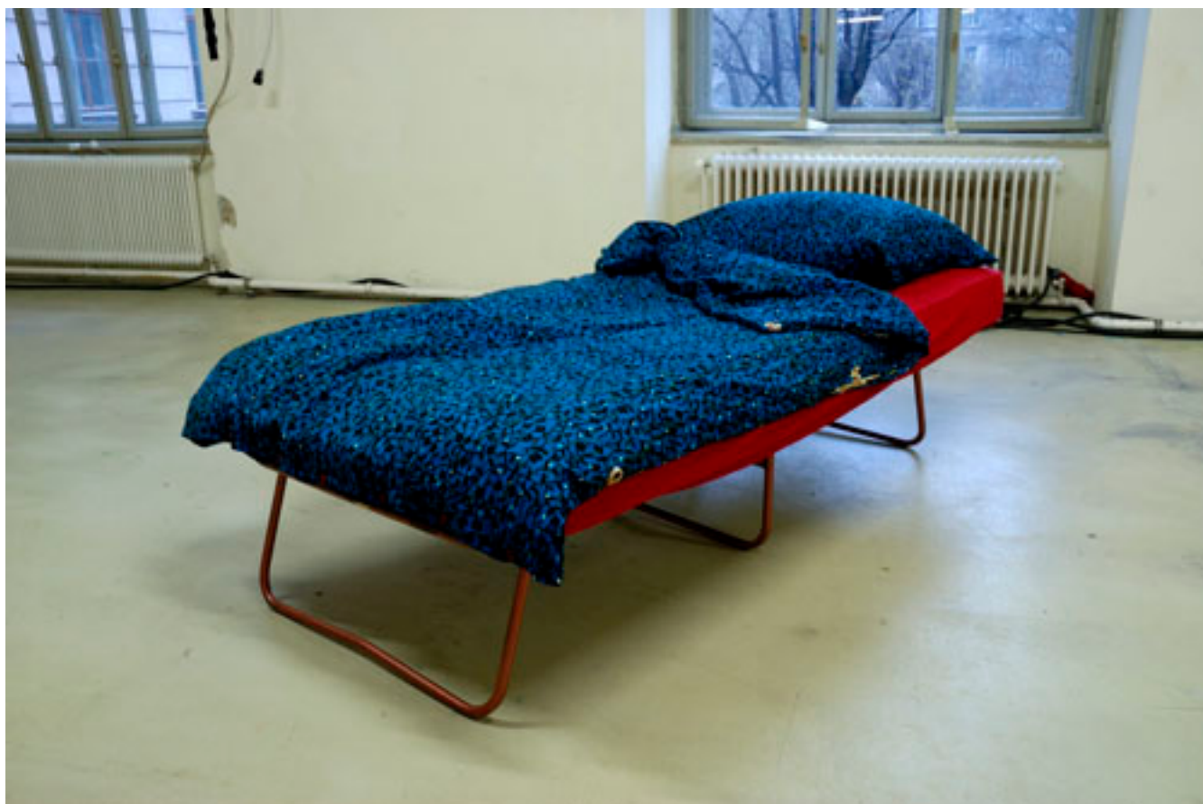
DER STOFF, DAS BETT 1