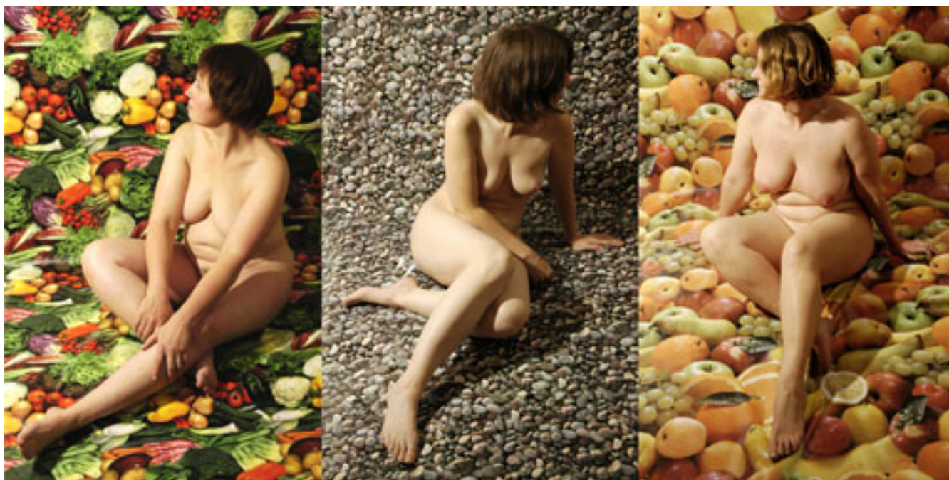
CAJA CHICA 2