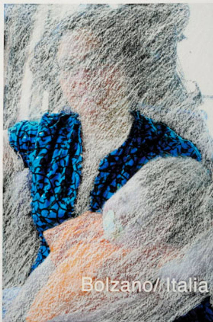
DER STOFF, DAS BETT 2