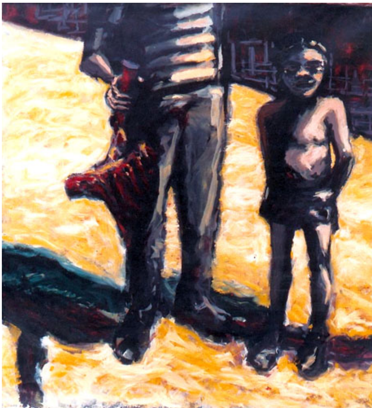
AU MARCHÉ NOIR 1