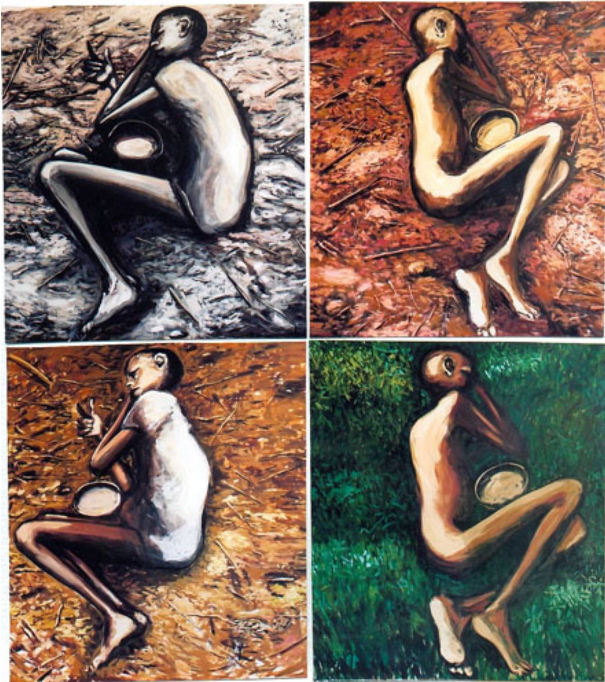
LE DEJEUNER SUR L'HERBE (SOMALIE)