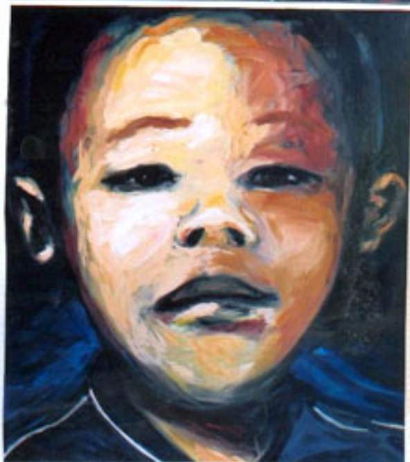
ENFANT CORÉEN I, II, III, IV