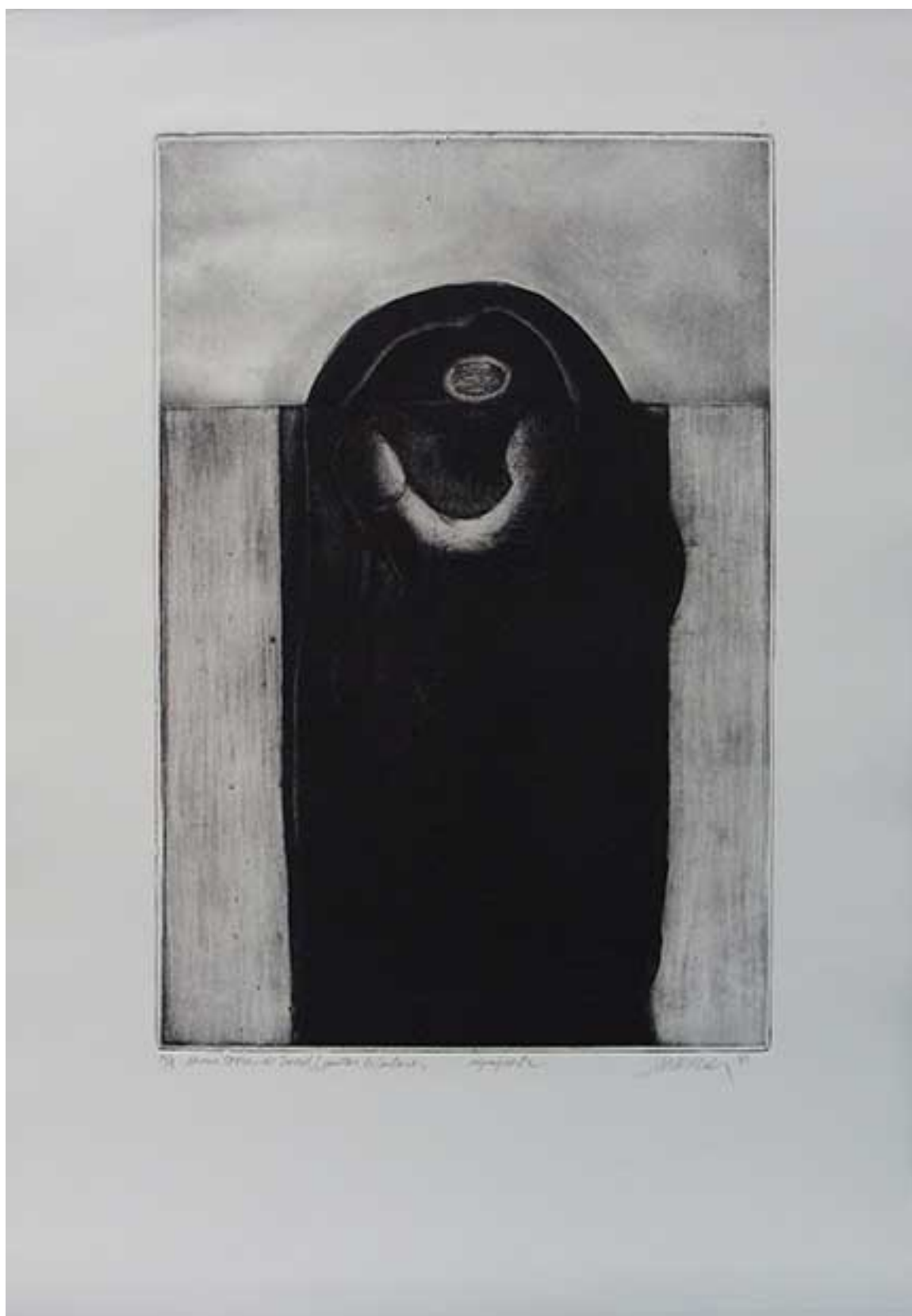
¡COMO TORRE DE DAVID! DE LA SERIE EL CANTAR DE LOS CANTARES