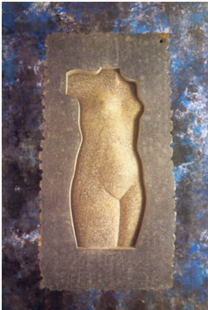
PERFIL DE MUJER