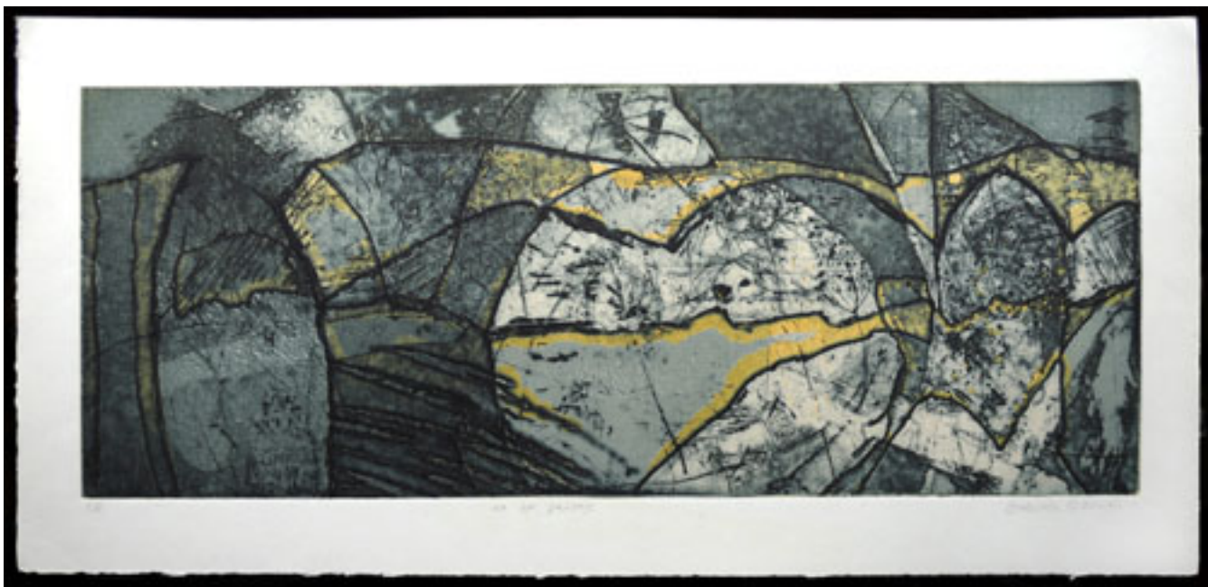
EN UN PAYSAGE