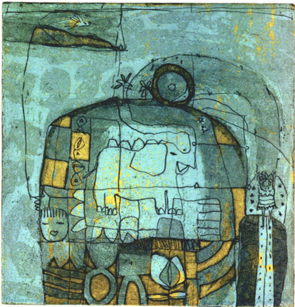
JUEGOS DE UNA NIÑA