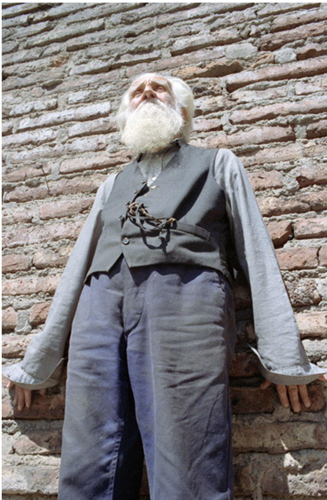
CONTRA LA PARED ( Surdoc )