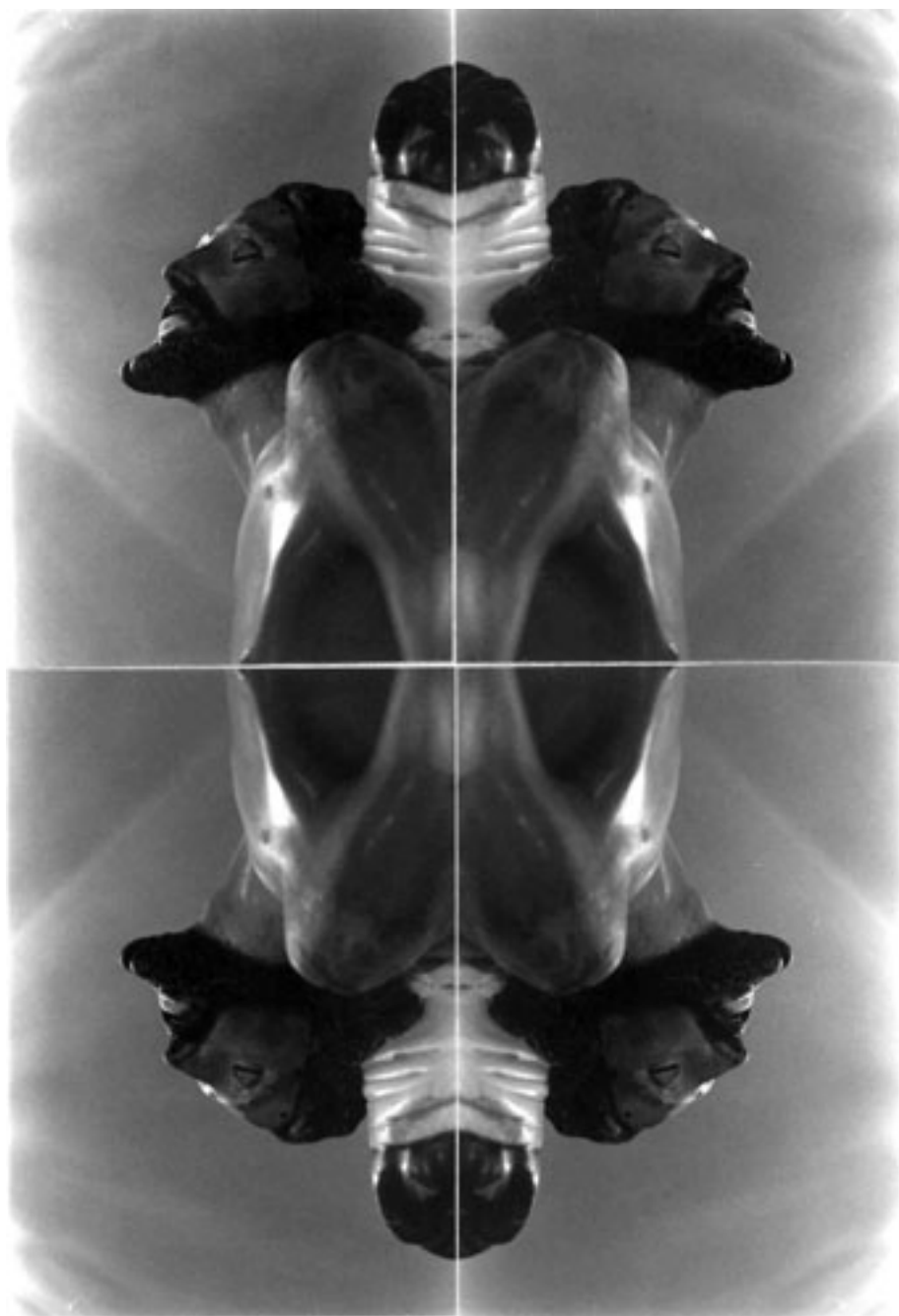
LOS CUATRO SIGNOS