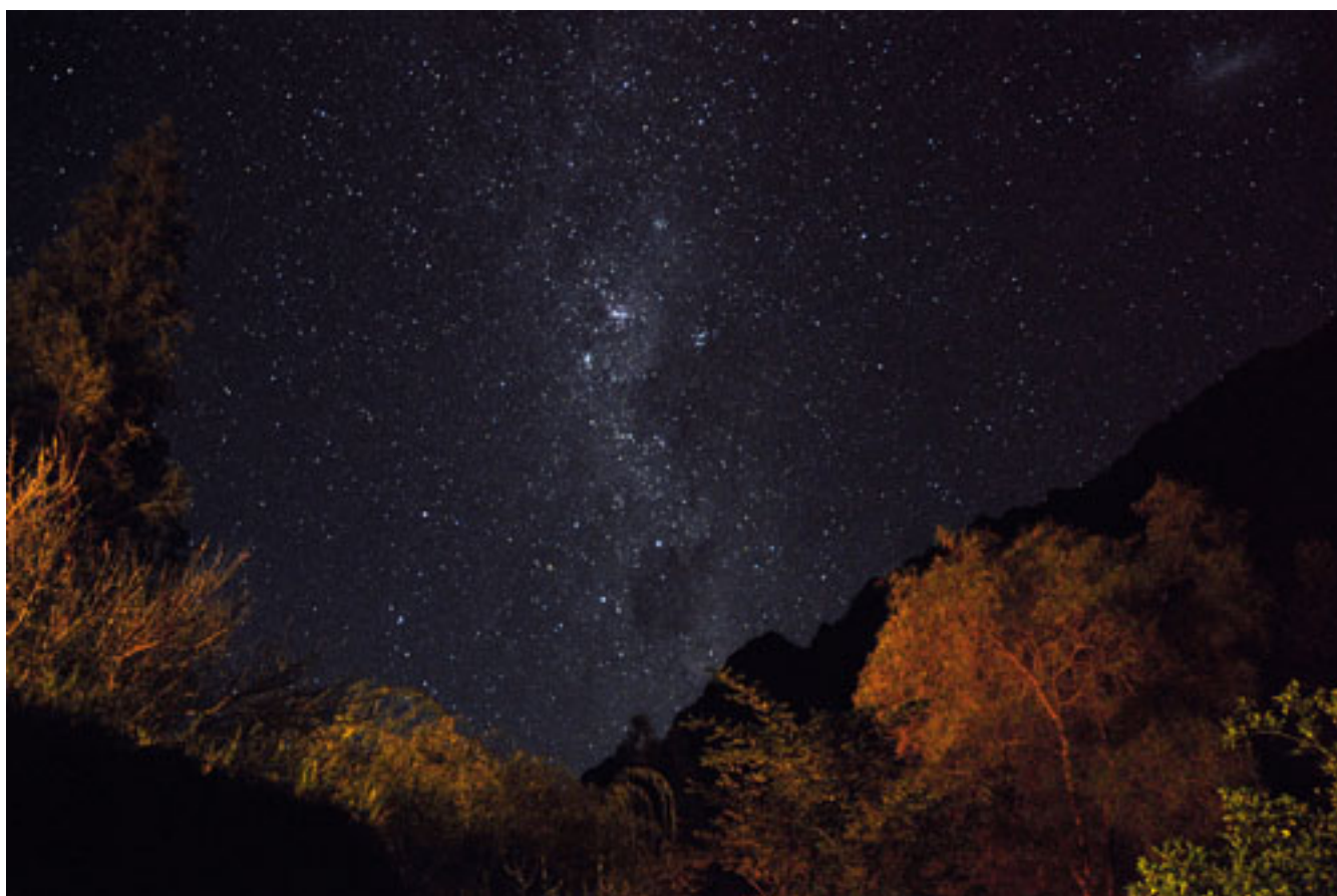
ETERNA COCHIGUAZ 2