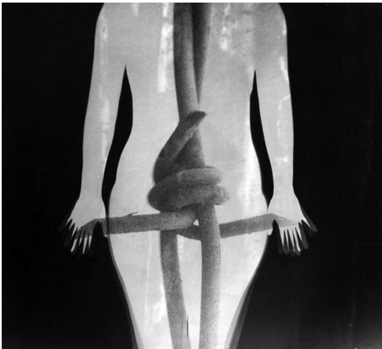
ALAMBRE DE PÚA