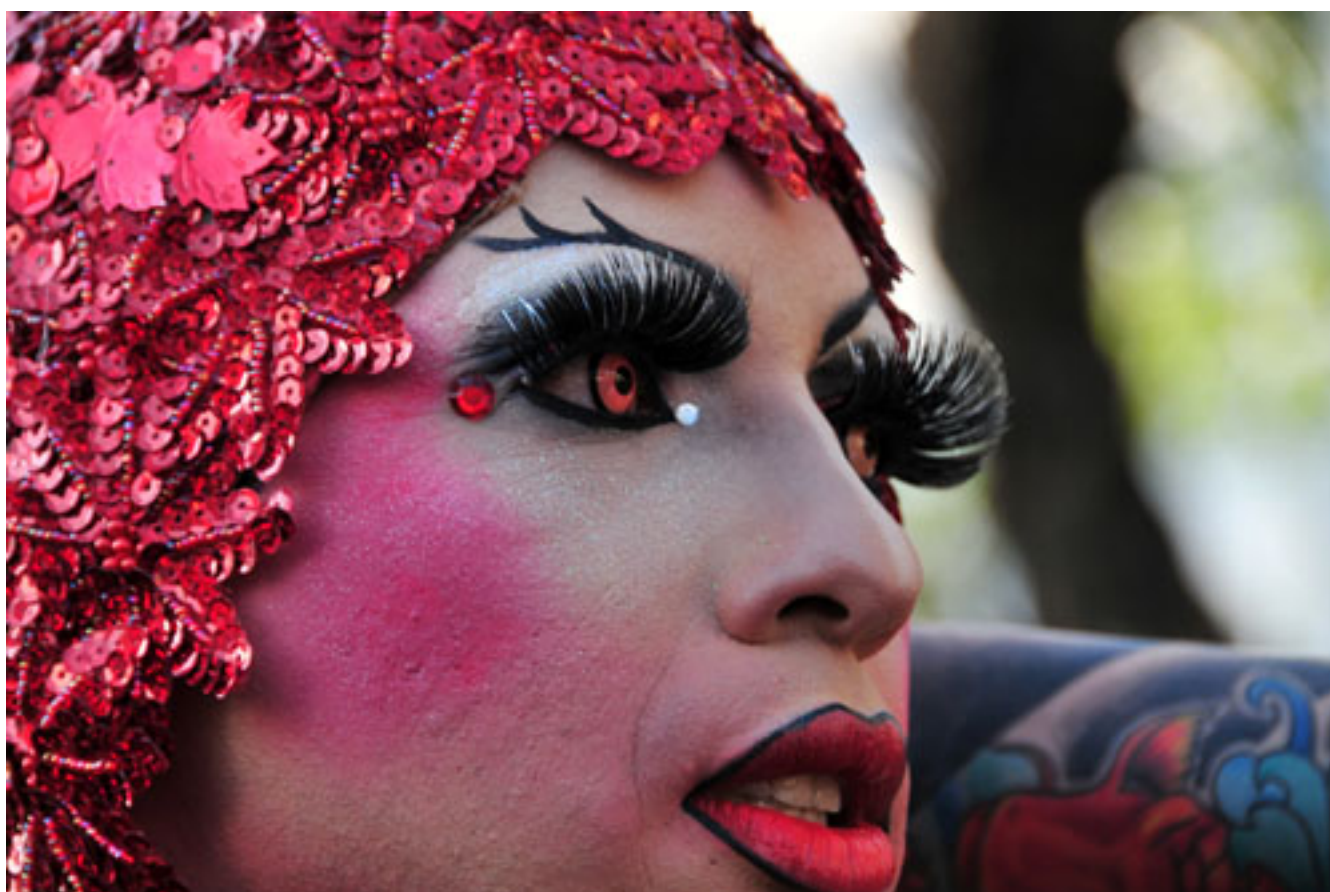
LAS CARAS DEL ORGULLO