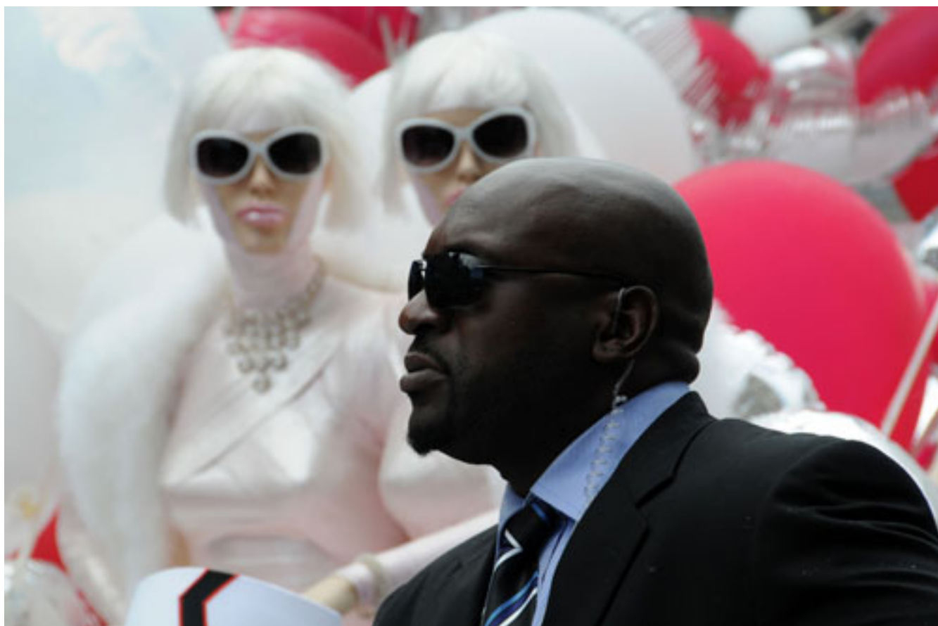
LAS CARAS DEL ORGULLO