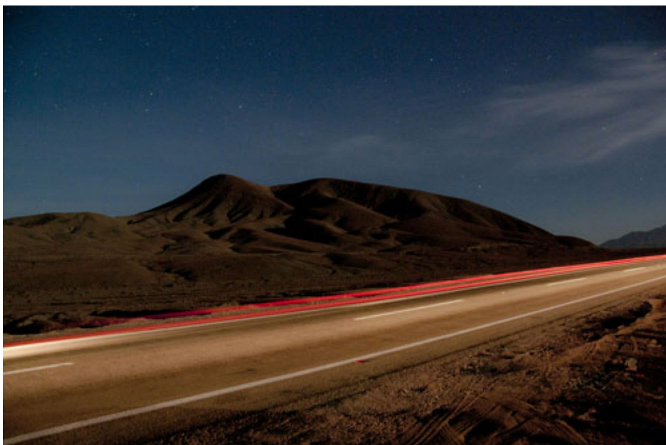
CAMINO A INCA DE ORO