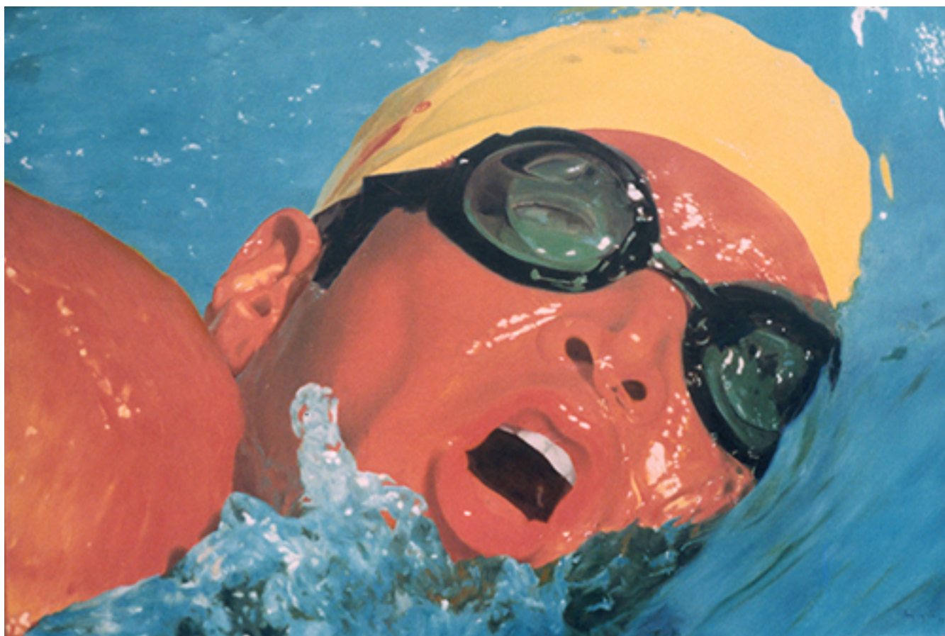
NADADOR N° 1