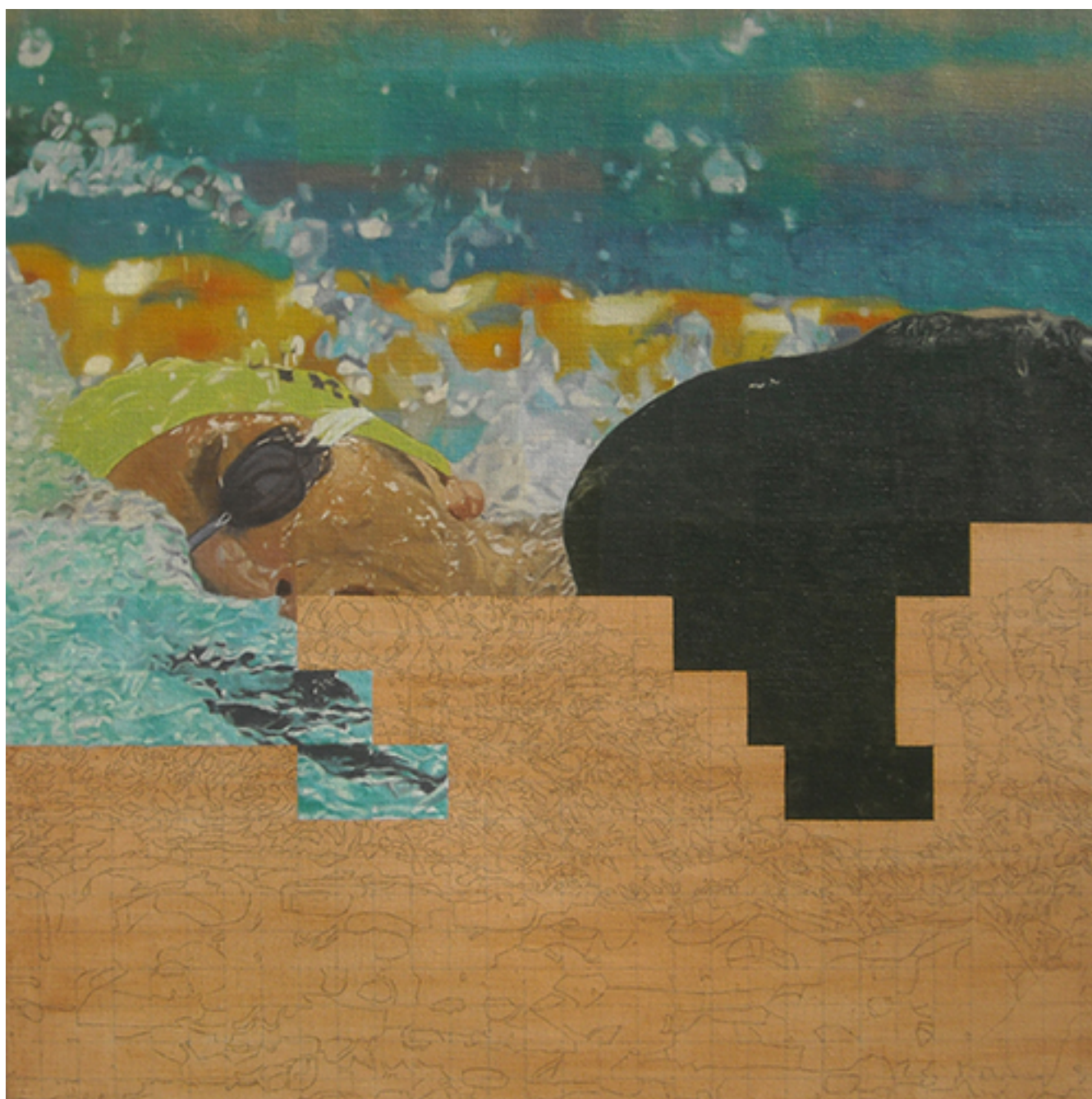
NADADOR N° 6