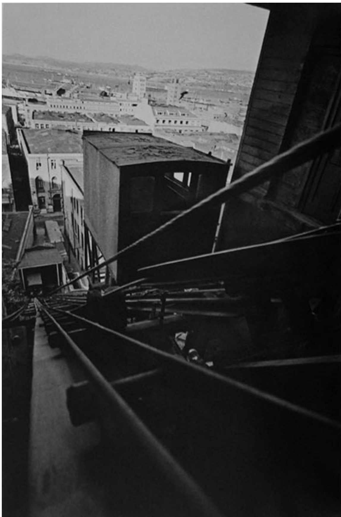
VALPARAÍSO DESDE EL ASCENSOR CORDILLERA