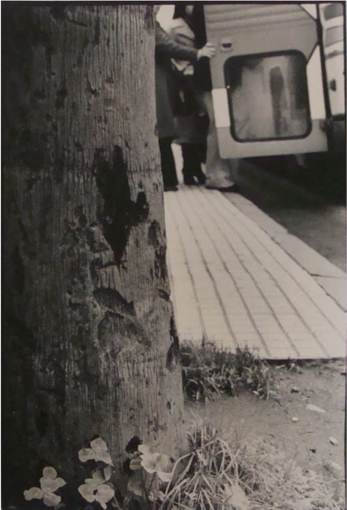
VIÑA DEL MAR