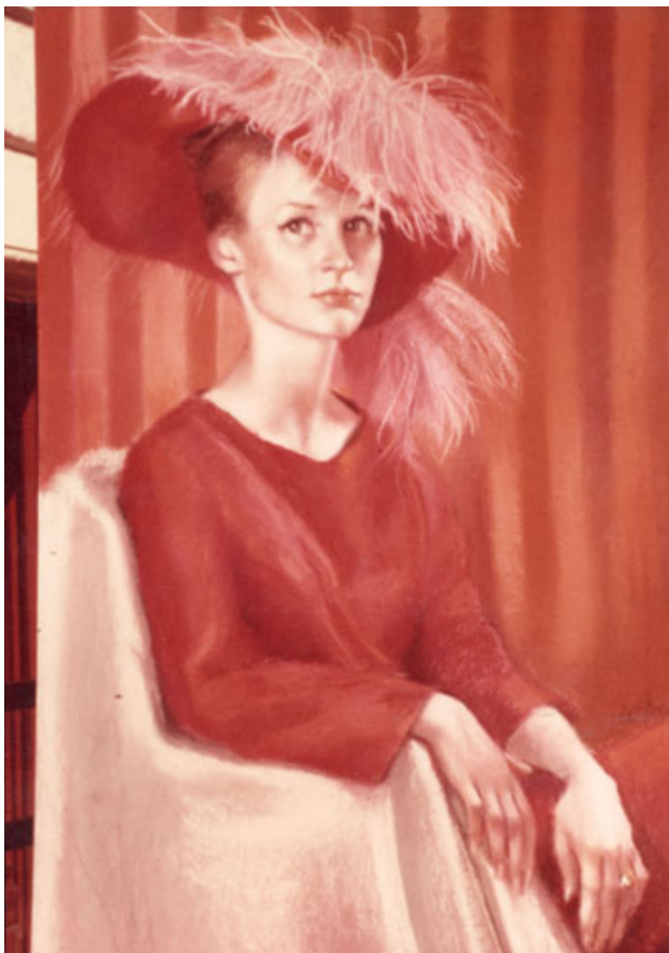
DAMA DE ROJO