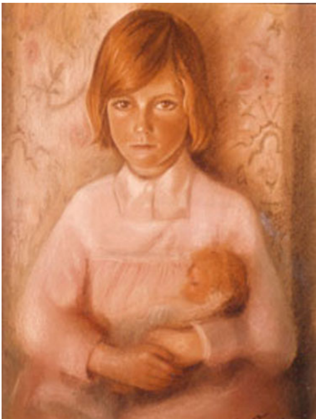
NIÑA CON MUÑECA