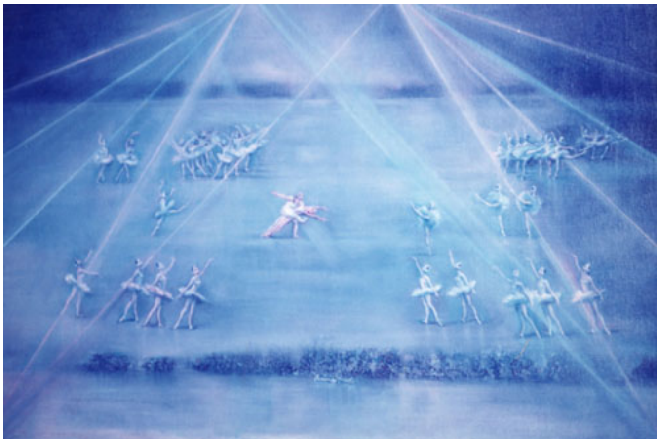
EL LAGO DE LOS CISNES