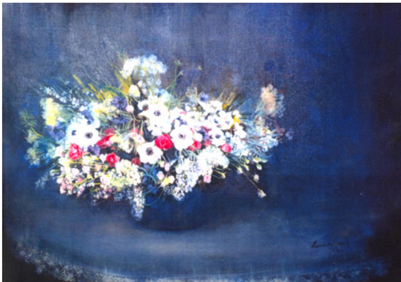
FLORES DE MAYO