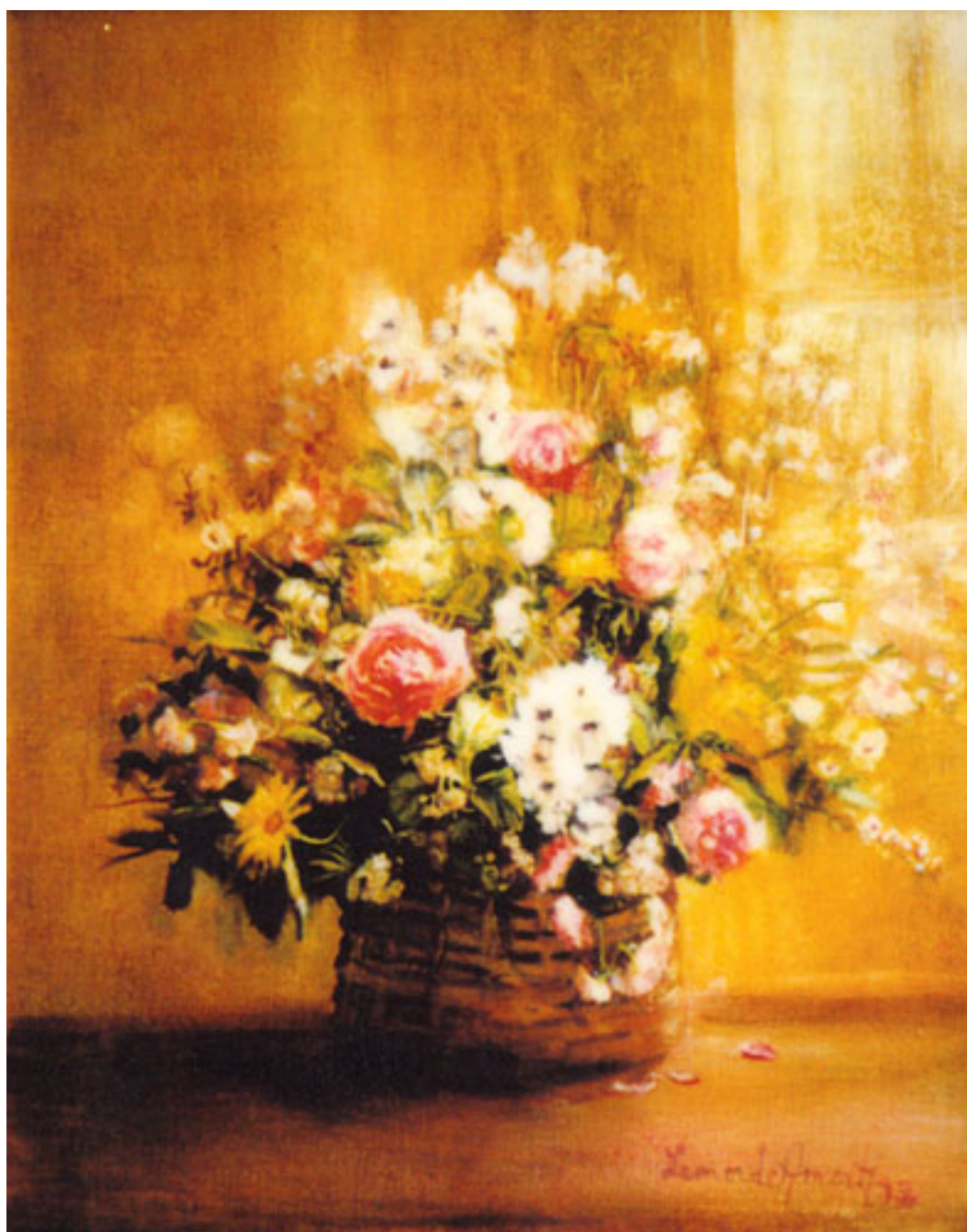
CANASTO DE FLORES