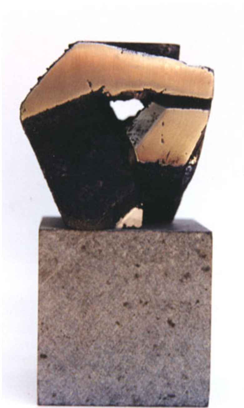
H. CUBO 11