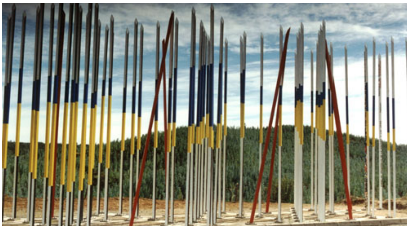
LANZAS, HOMENAJE A ARAUCO