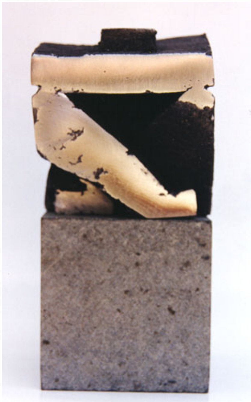
H. CUBO 12