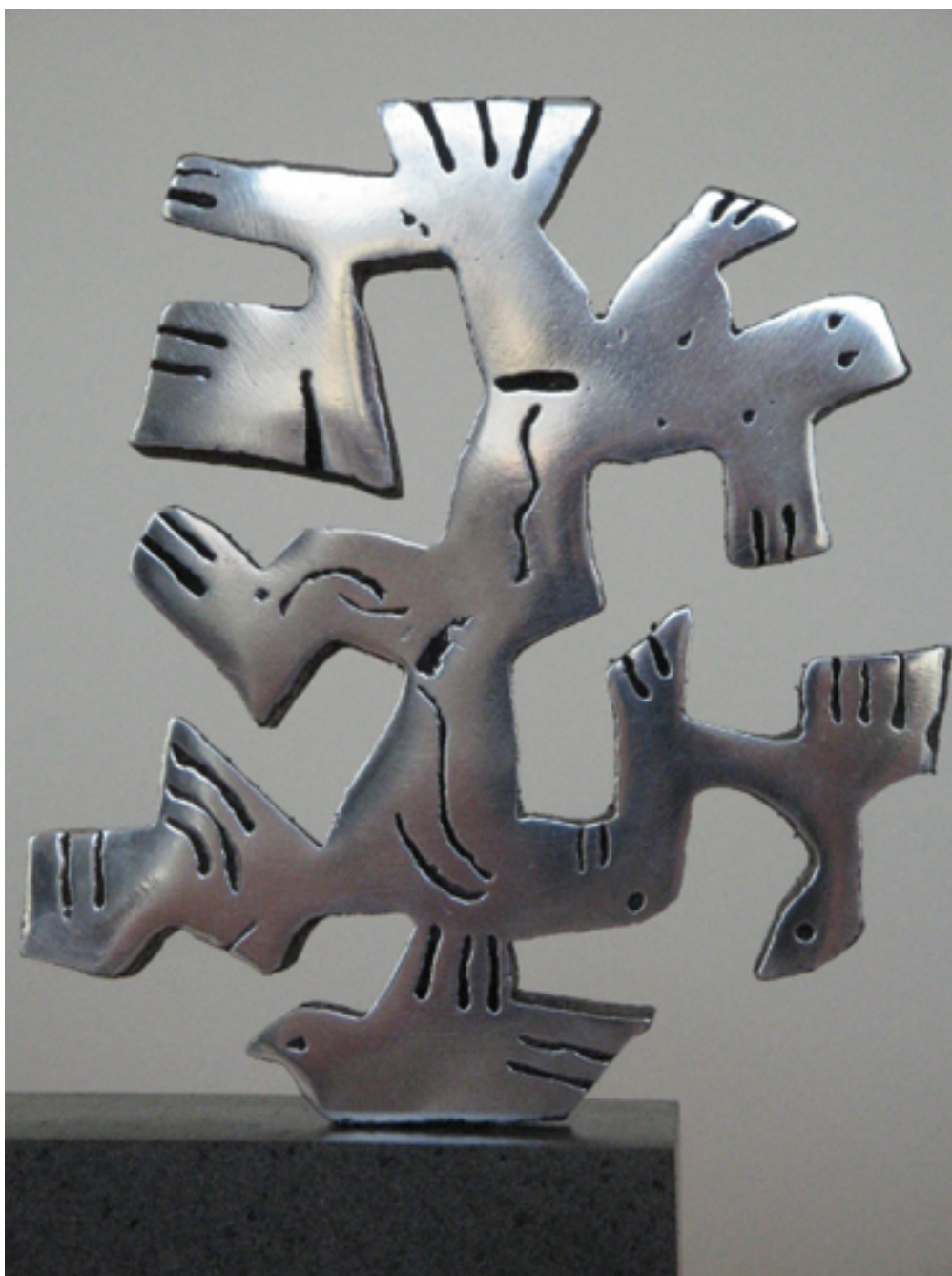
ÁRBOL DE LA VIDA