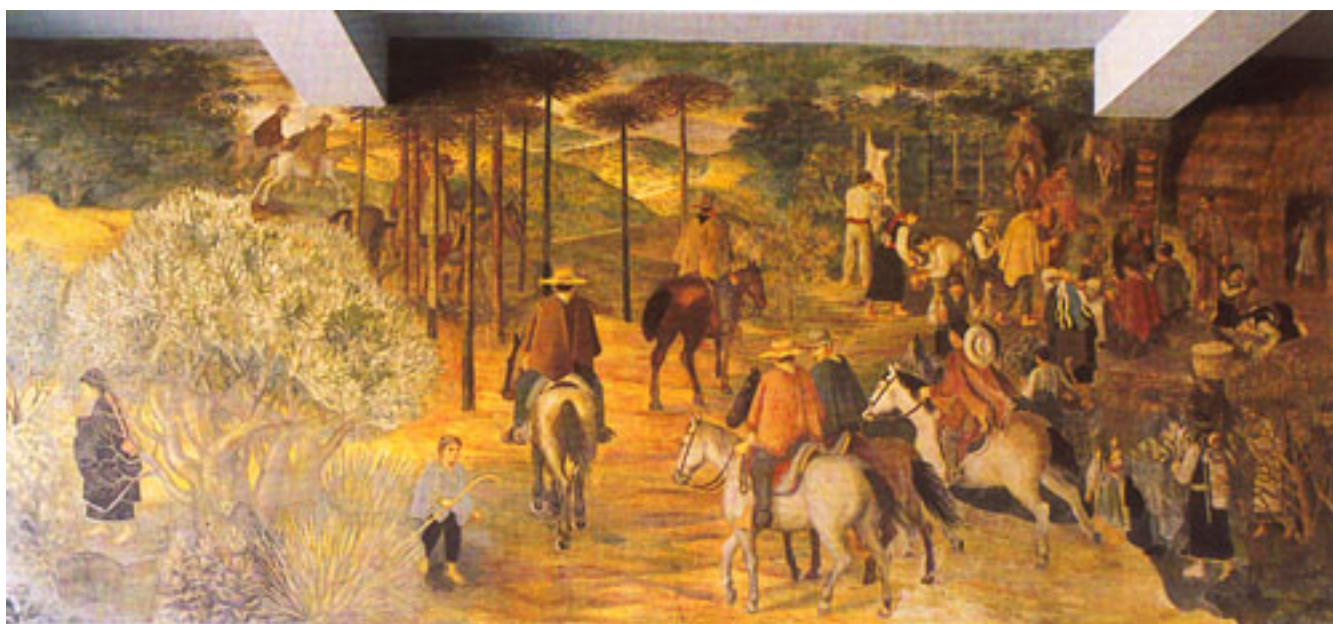
HOMENAJE A LA MEDICINA NATURAL (fragmento)