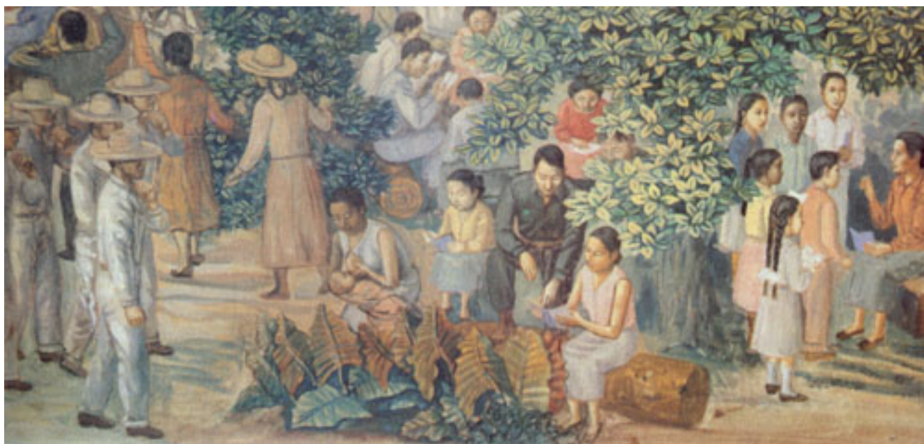
CAMPAÑA DE ALFABETIZACIÓN