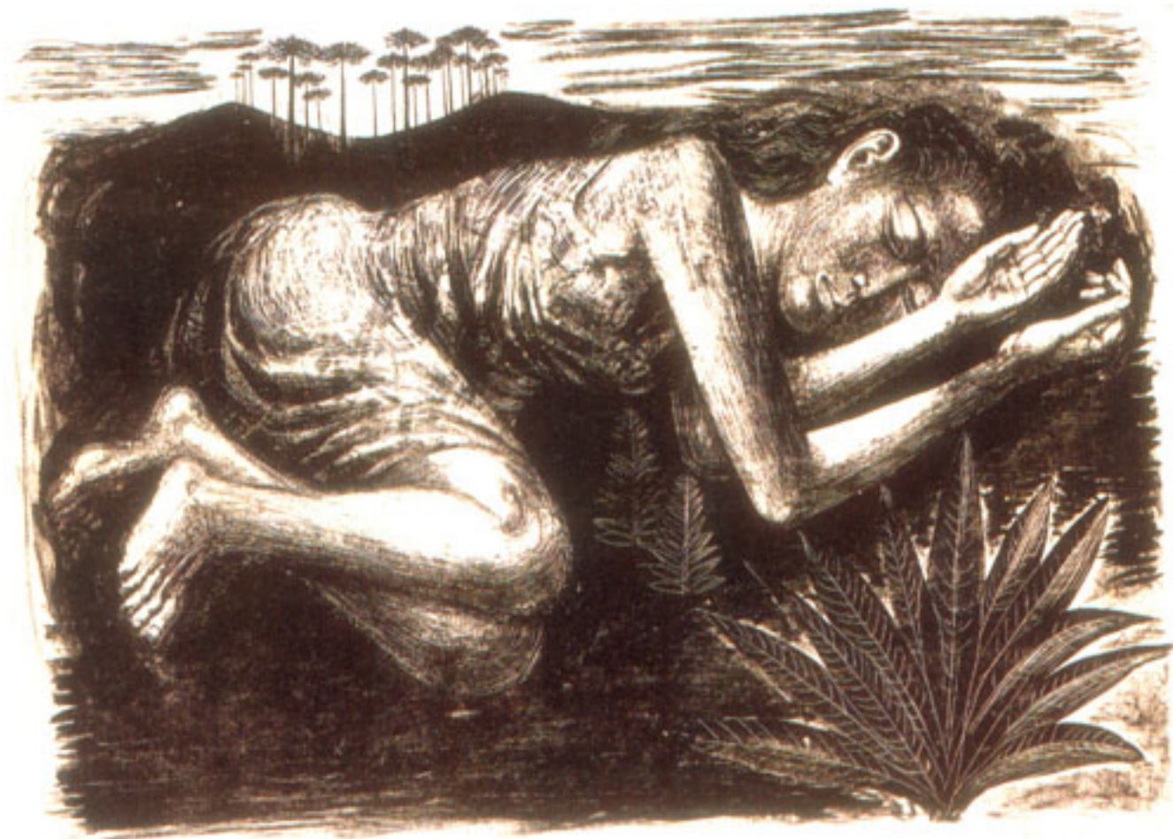
MUCHACHA DEL SUR