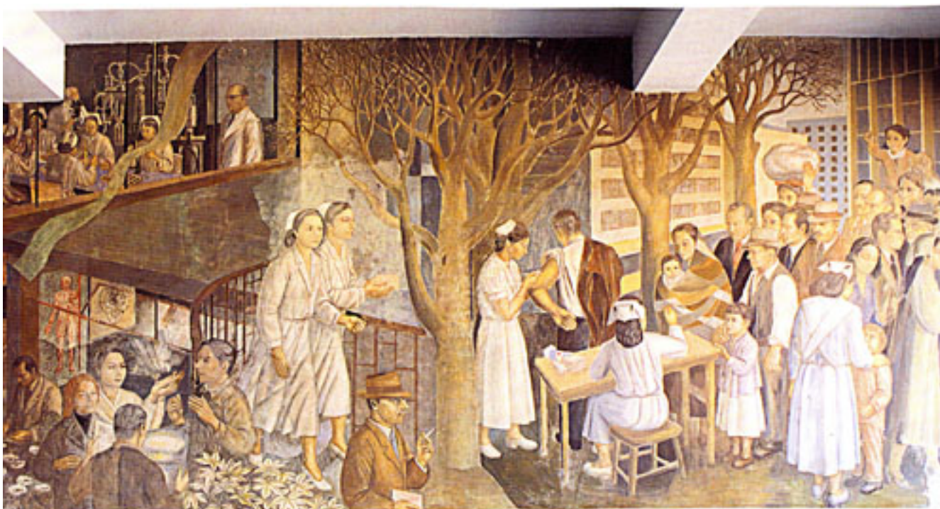
HOMENAJE A LA MEDICINA, LA VACUNACIÓN