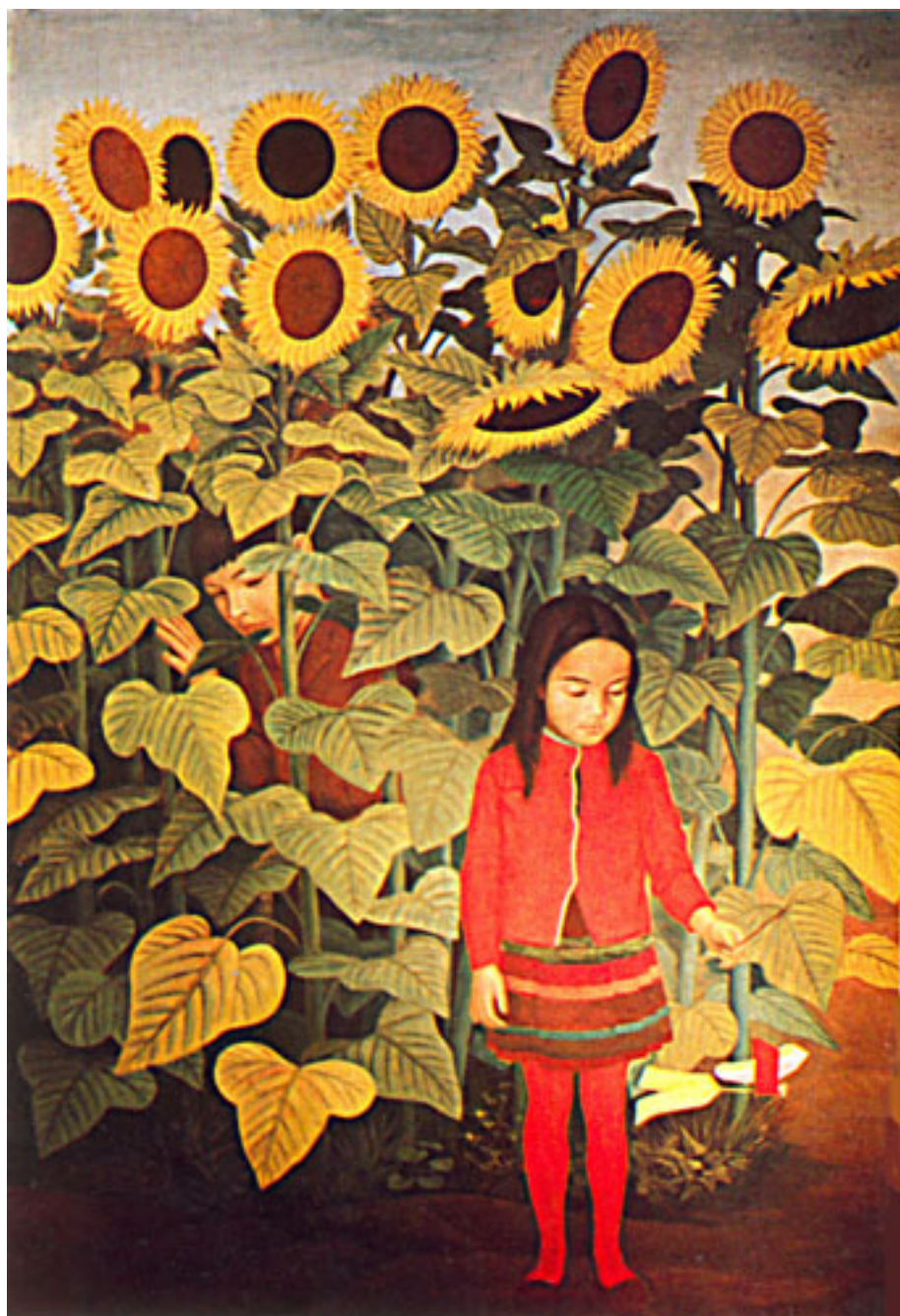
NIÑOS Y GIRASOLES