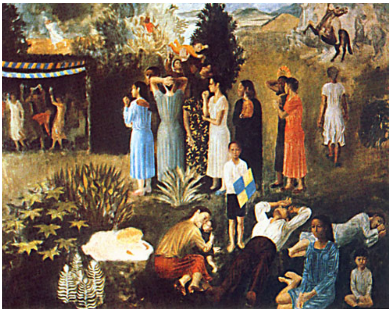
FONDA DE FIESTA

MUSEO NACIONAL DE BELLAS ARTES. Exposición y entrevista a Julio Escámez [Videograbación]. 1995. DVD. (Disponible en Sala de Lectura de la Biblioteca MNBA)