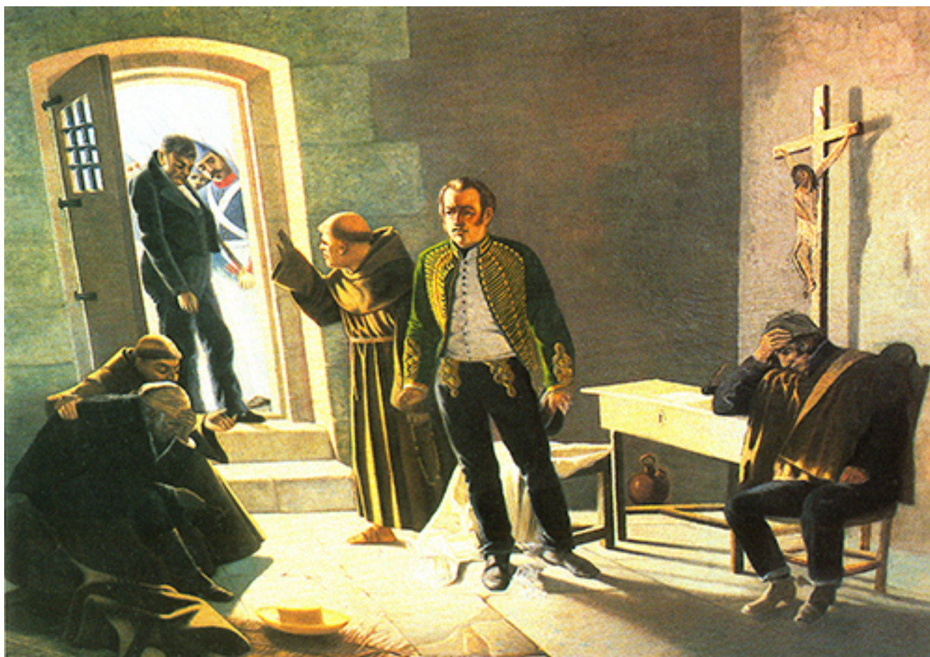
LOS ÚLTIMOS MOMENTOS DE CARRERA