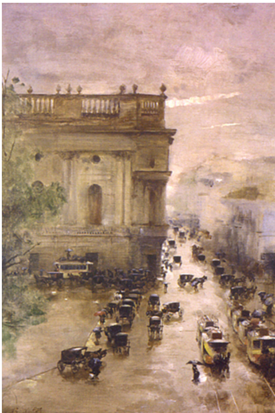
PLAZA DE LA COMPAÑIA