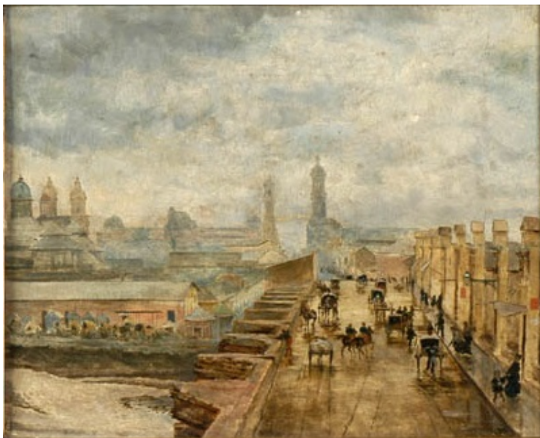
PUENTE DE CAL Y CANTO