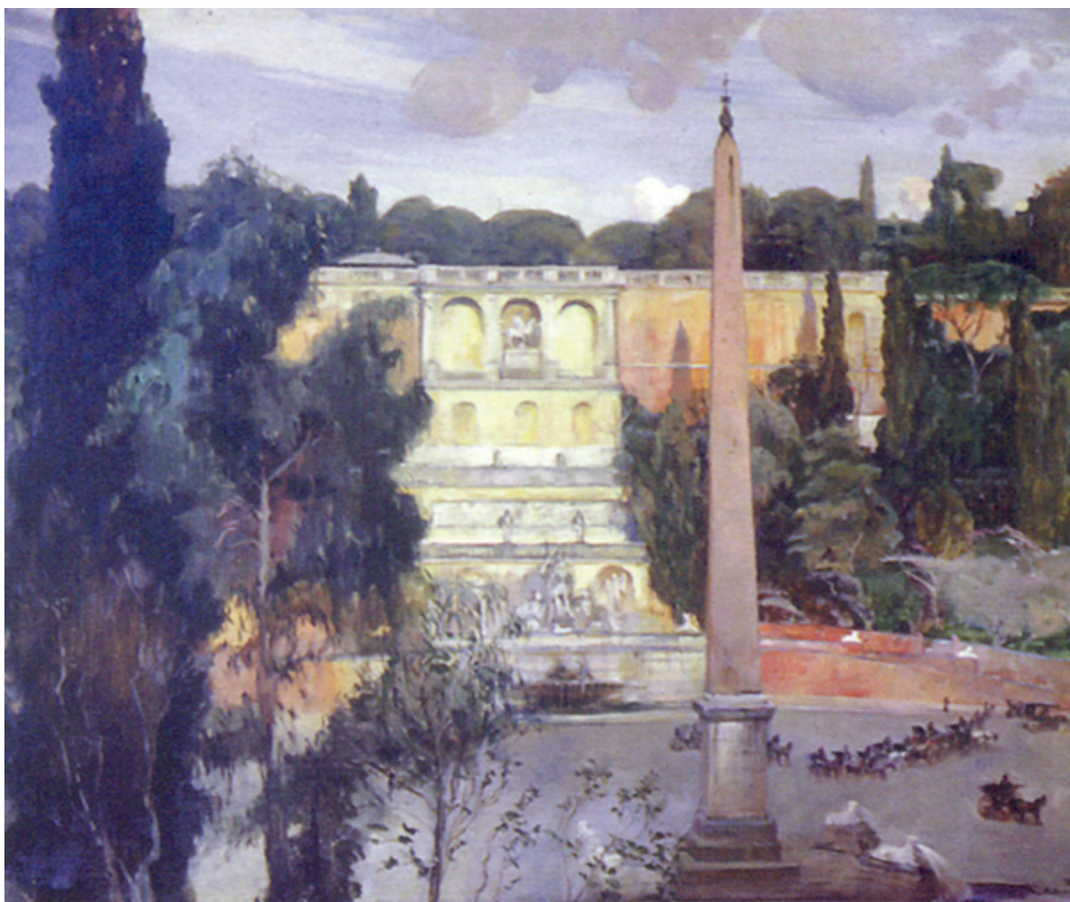
PIAZZA DEL POPOLO