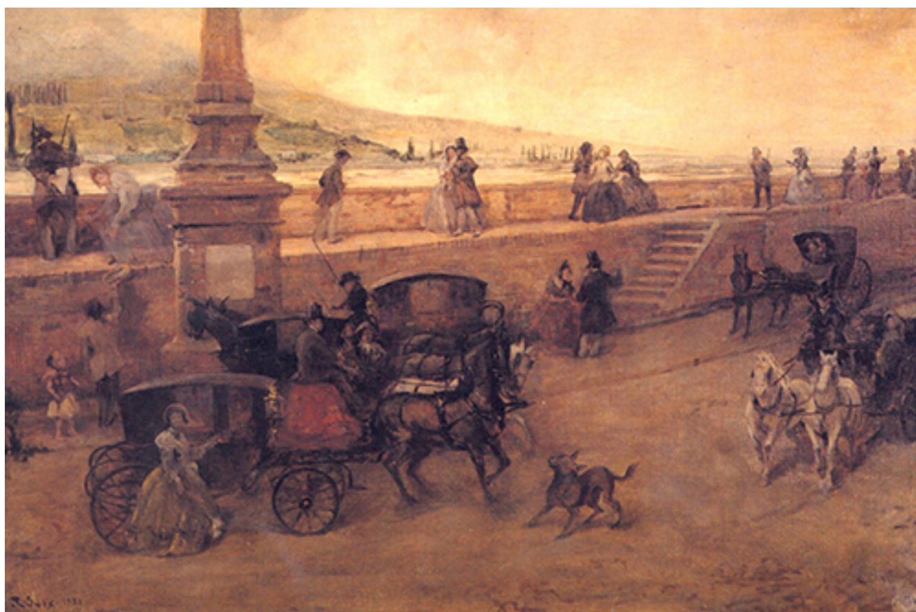
PASEO EN EL TAJAMAR