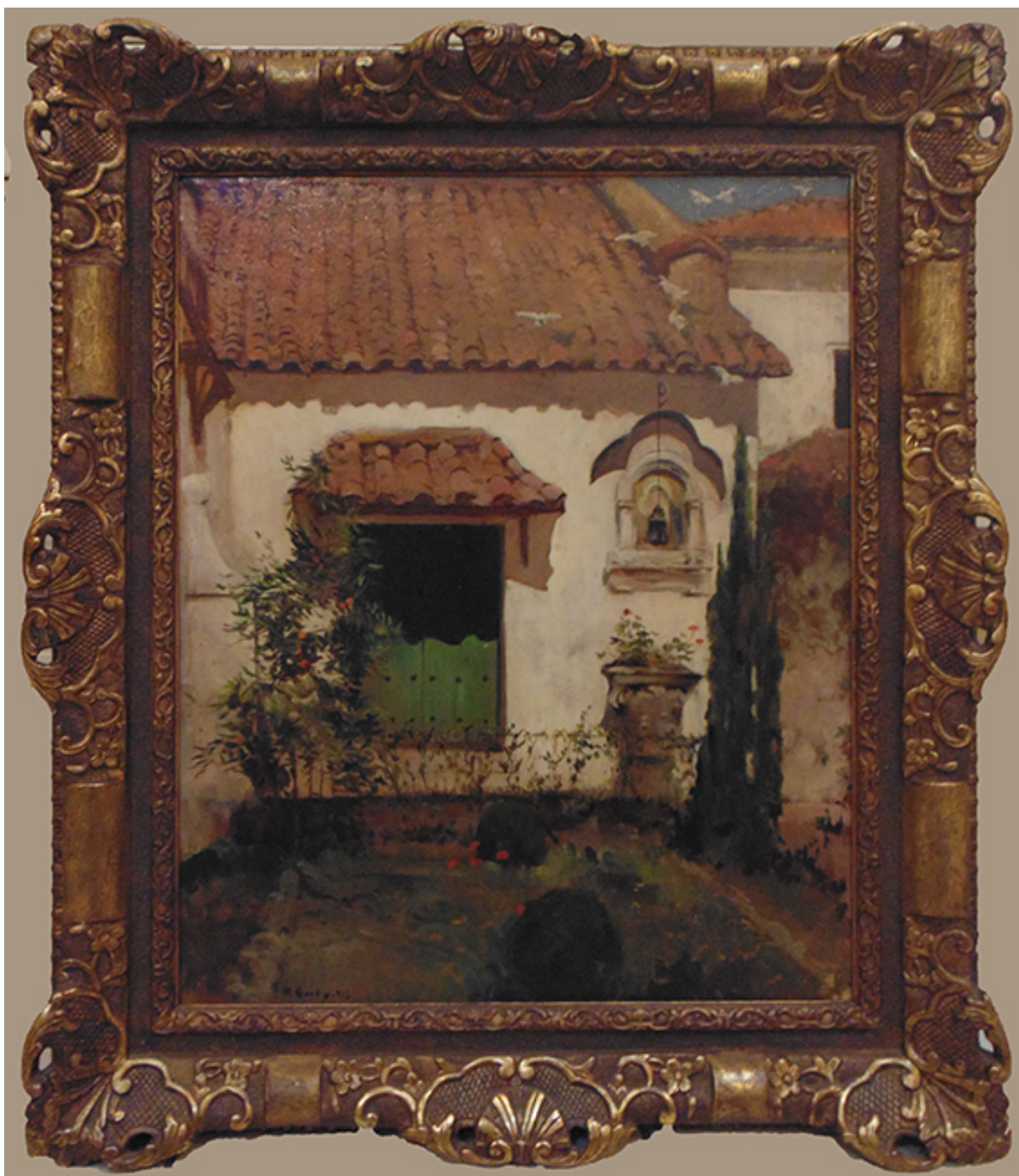
ENTRADA AL TALLER EL LLANO