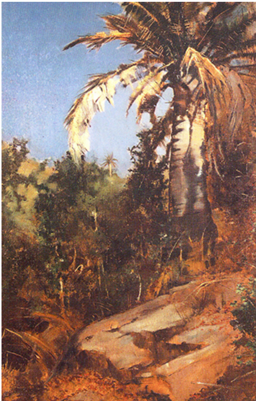
INTERIOR QUINTA VERGARA