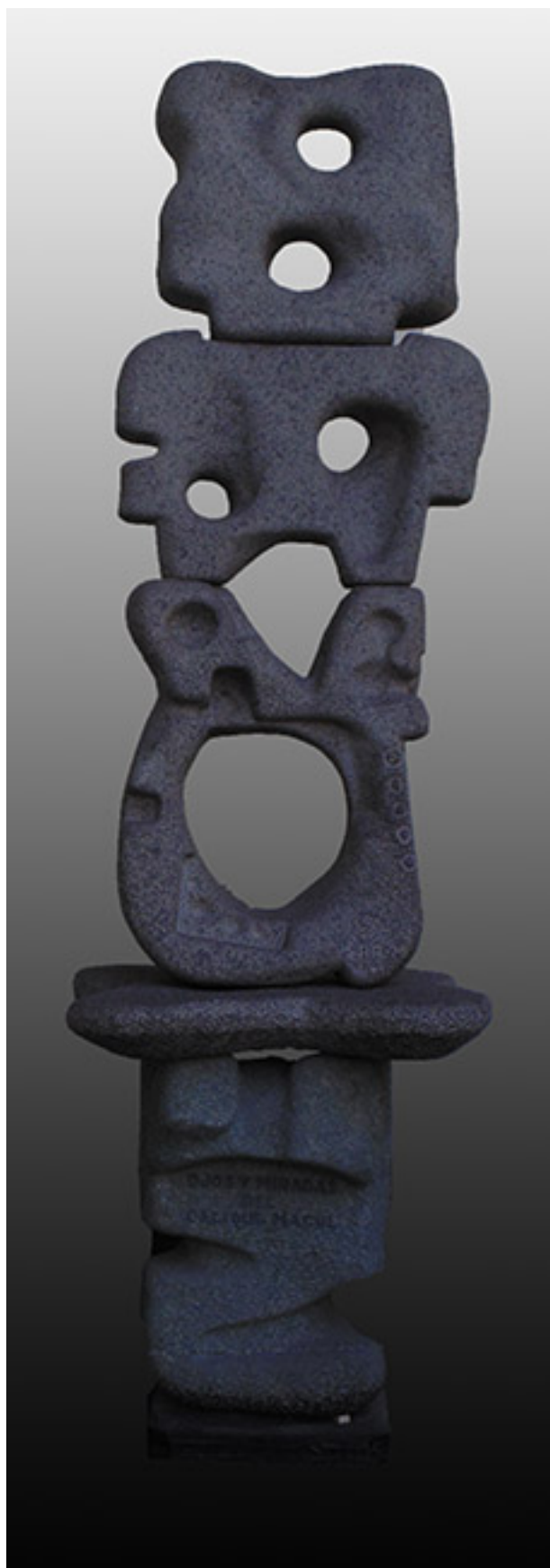
OJOS Y MIRADAS DEL CACIQUE MACUL