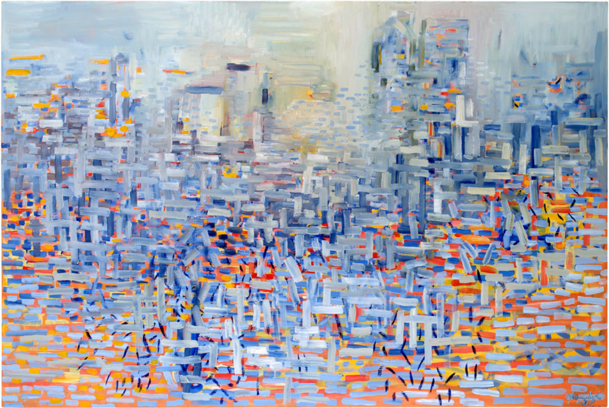
EAST SIDE VIEW 8