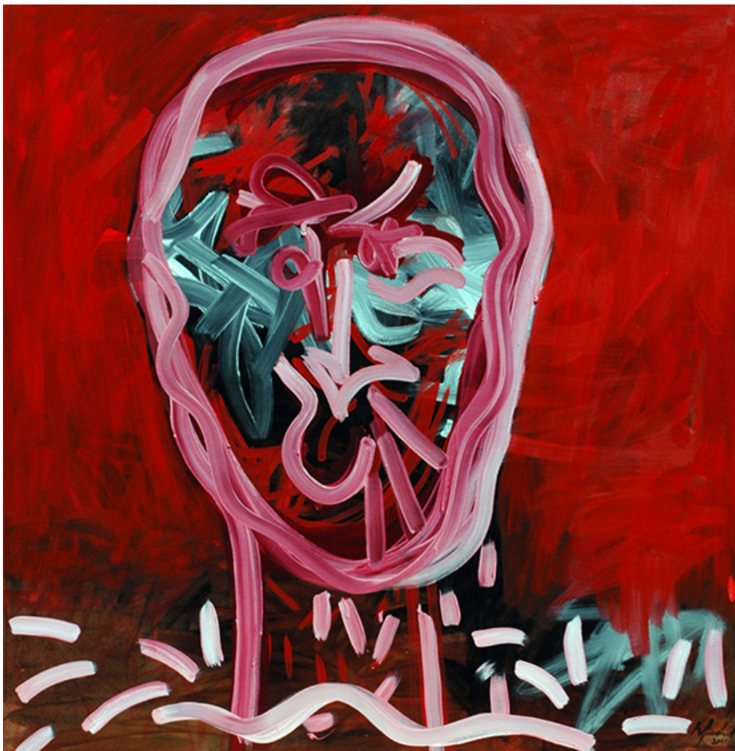
AUTORRETRATO DE INVIERNO 2