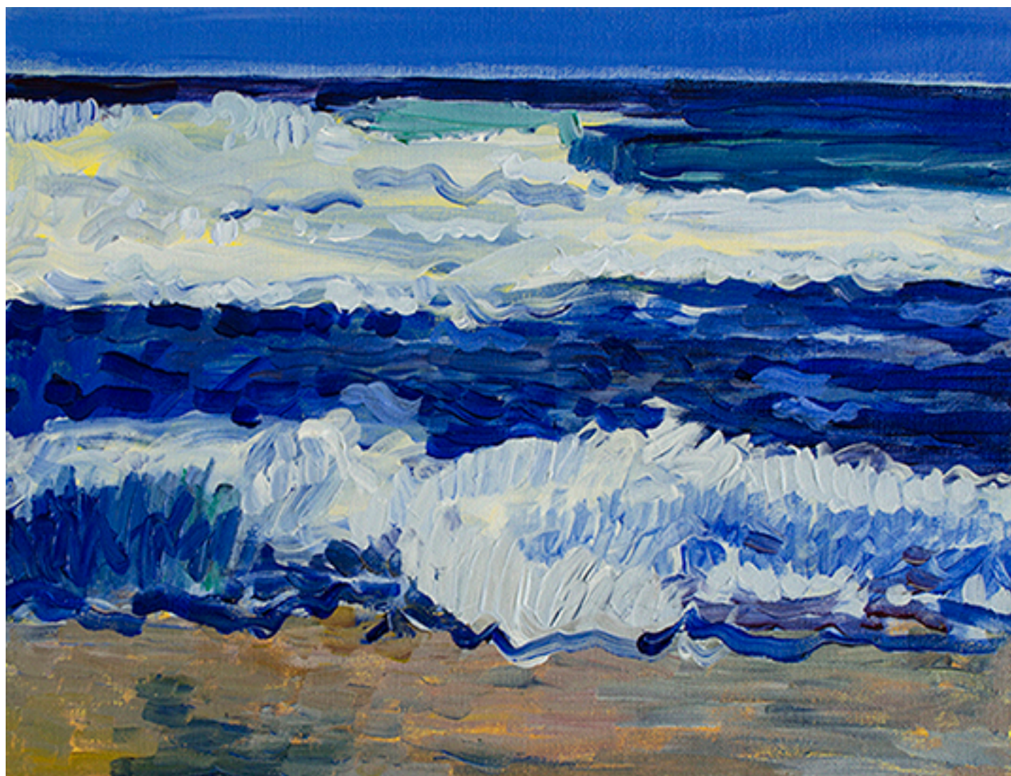
APUNTE LOS MOLLES IV