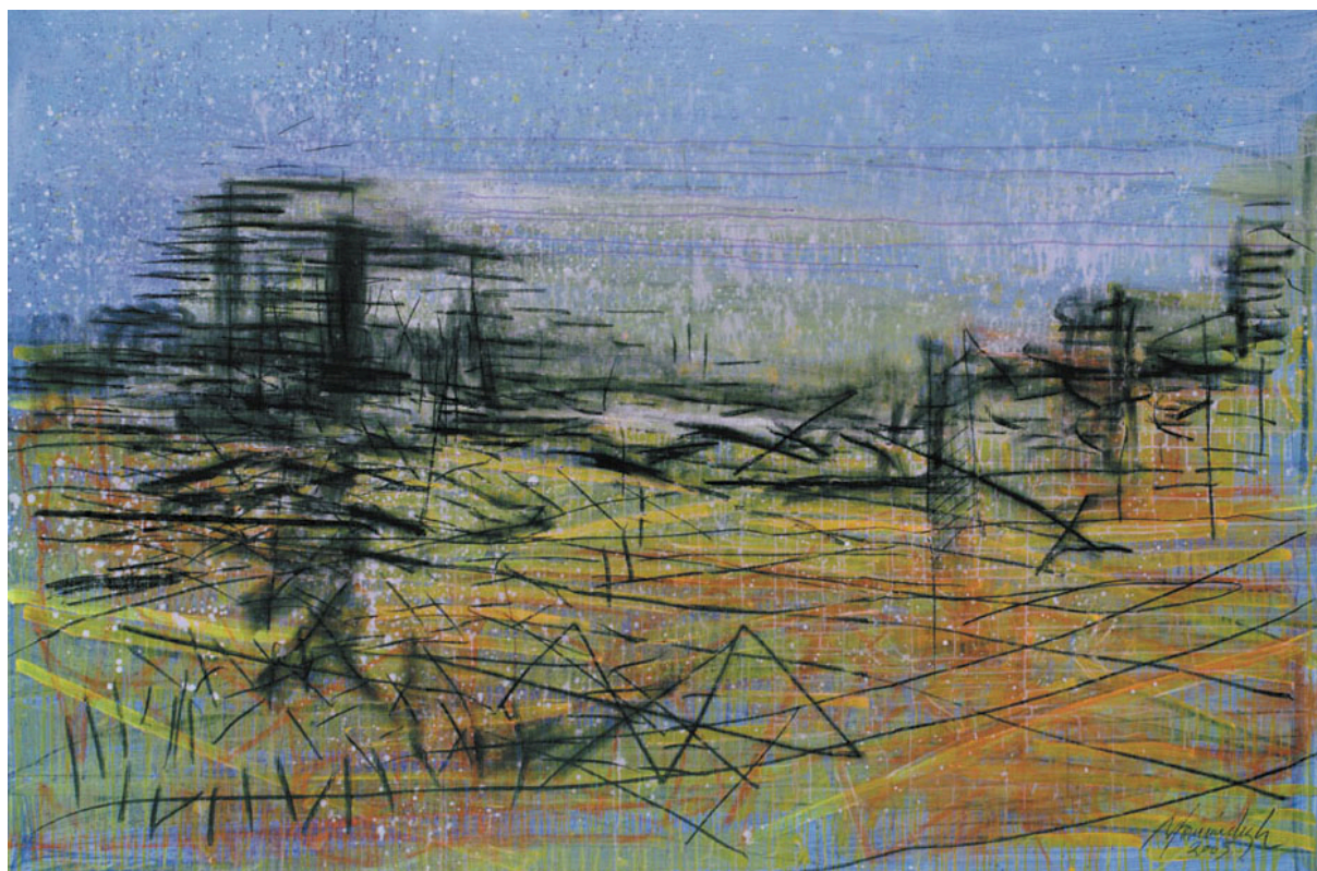
LOS MOLLES 3