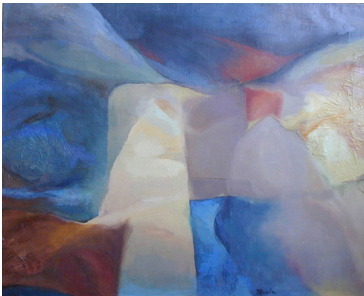
Aurora Monte Grande