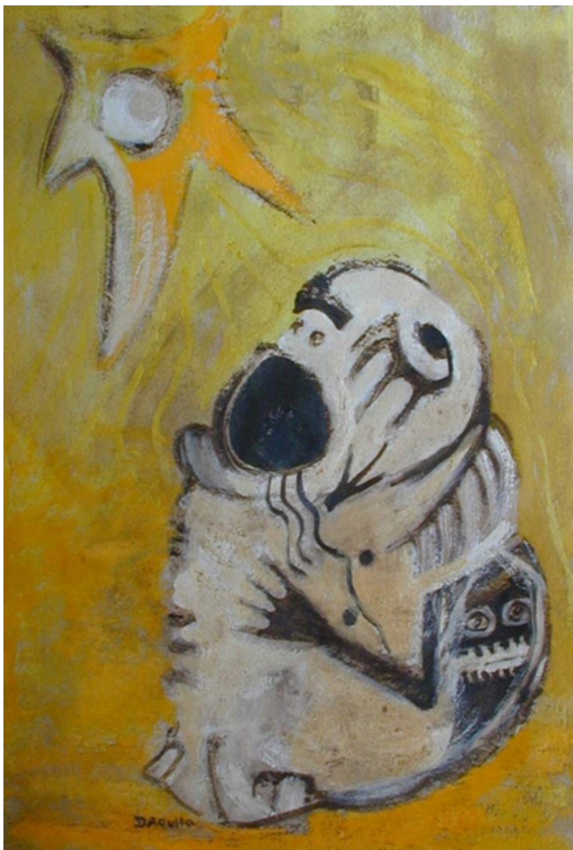
Plegaria al sol