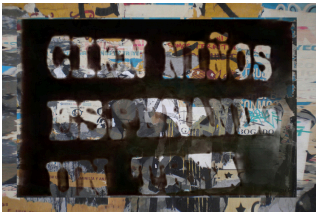
Cien niños esperando un tren