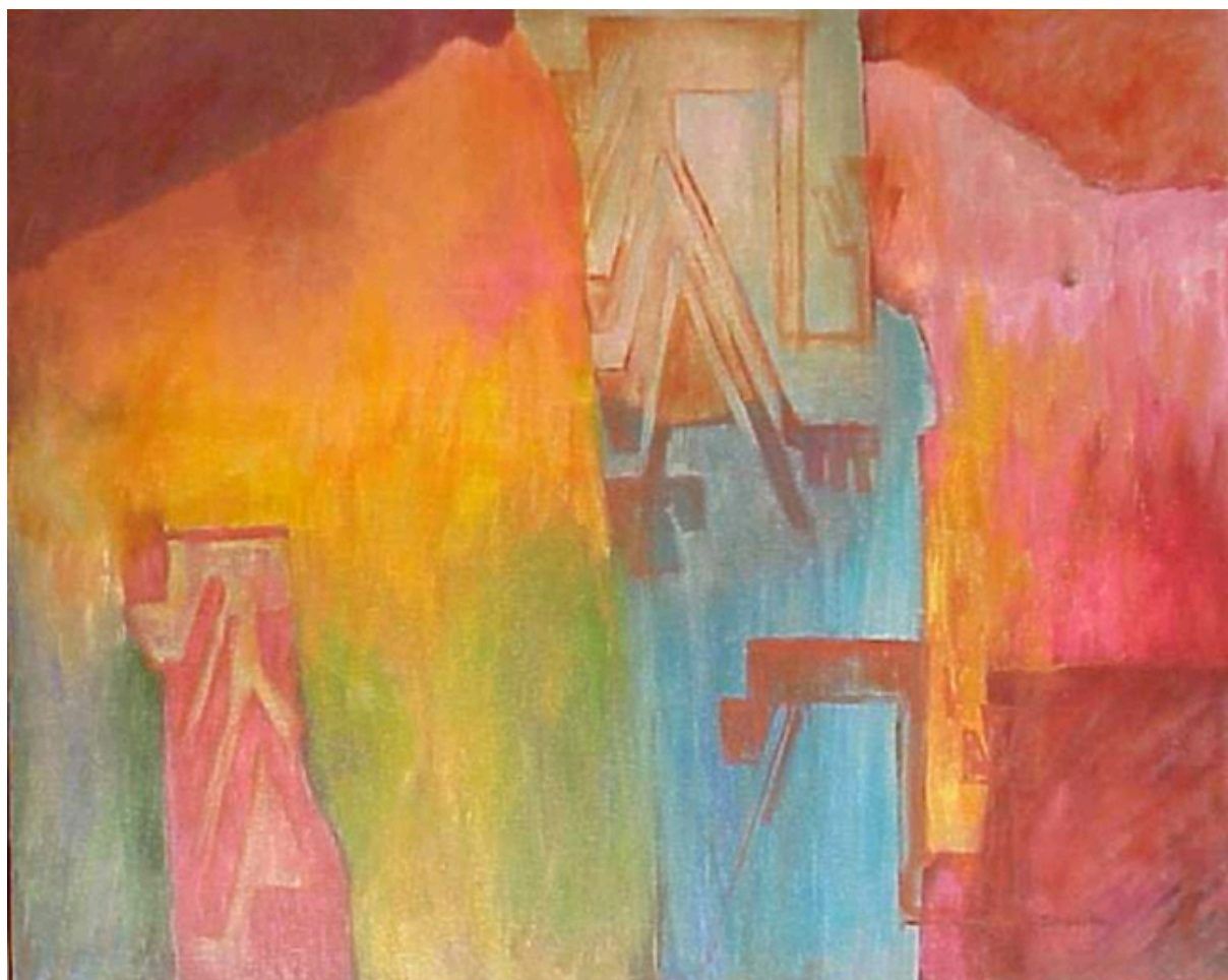
Aguas de Temu