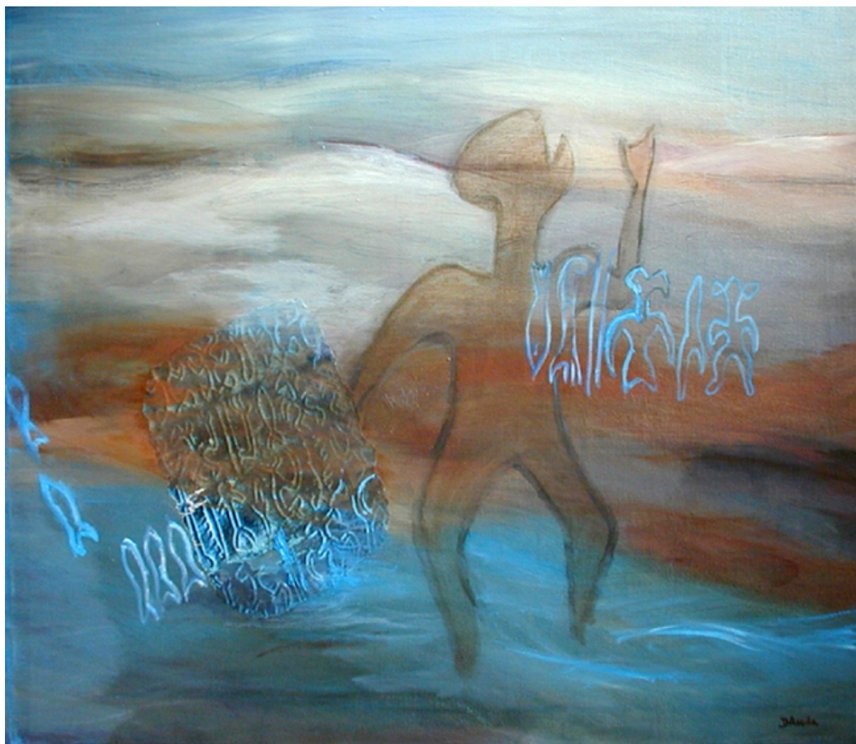
Hombre de la Isla