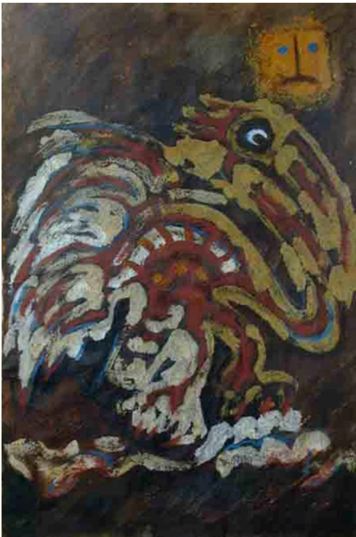
Sol y pájaro