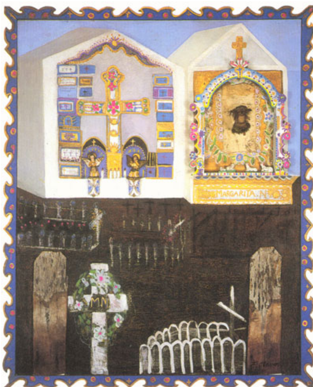
HOMENAJE A NERUDA