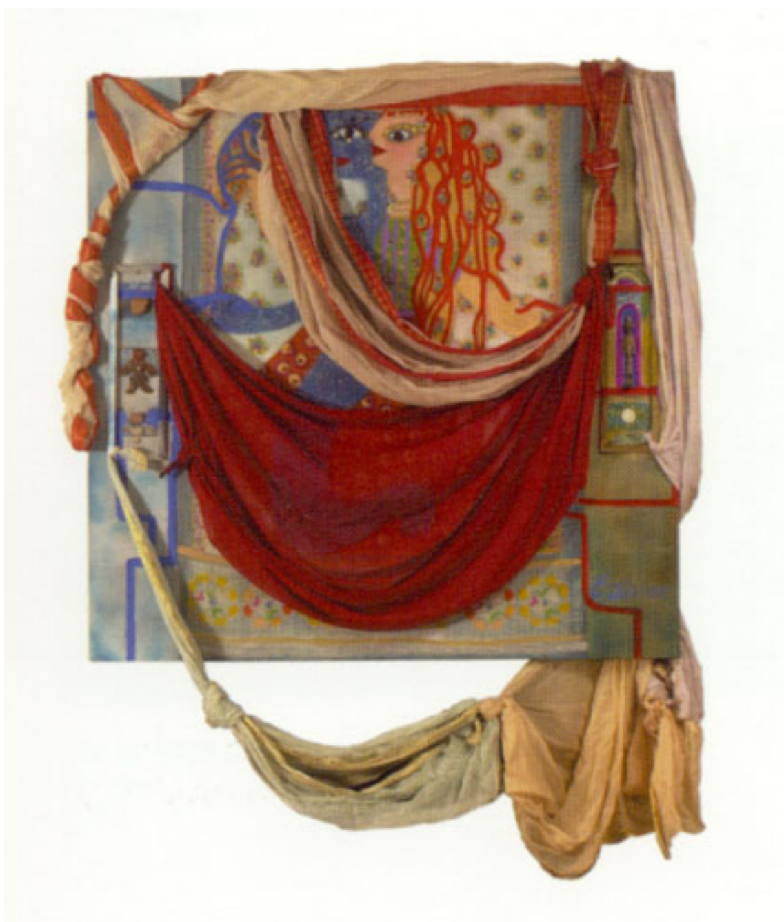
EL RETORNO DE JÚPITER Y SUS TESOROS