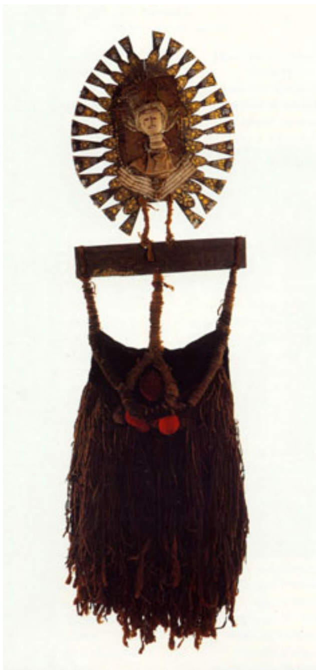
LA COLLA PRINCESA INCA