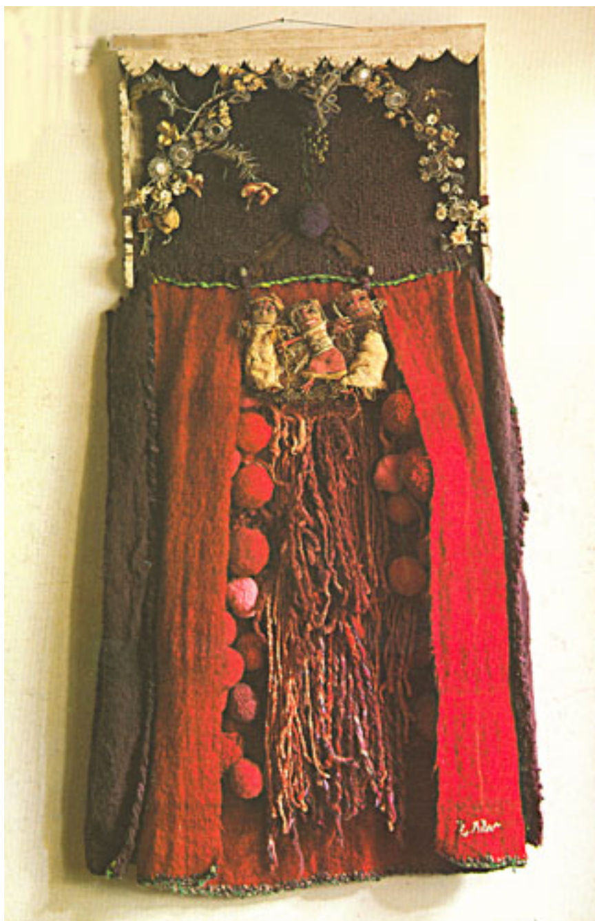
EL SECRETO DE LA CASA DE LOS ANTEPASADOS