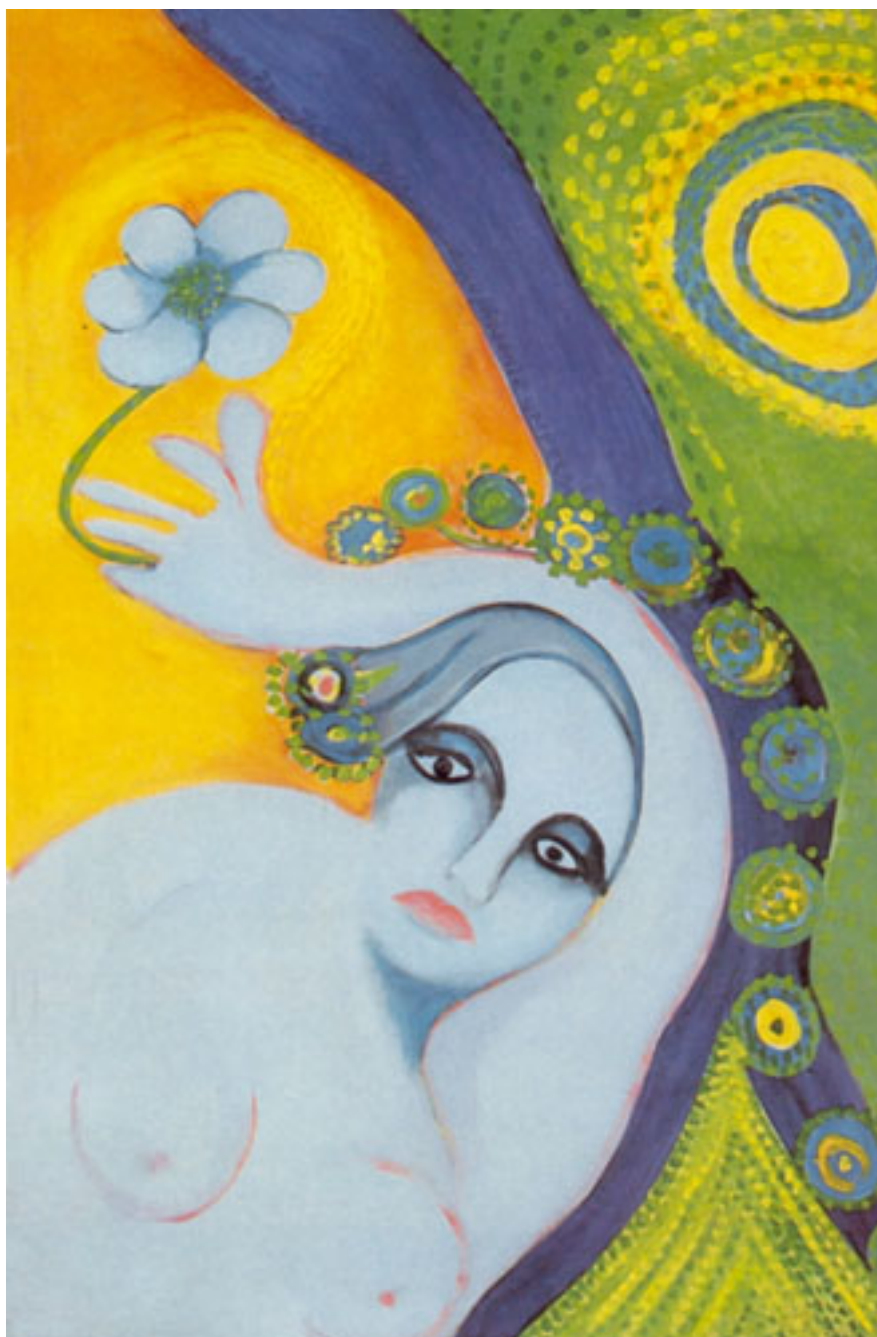
EL SOL DE MI MADRE