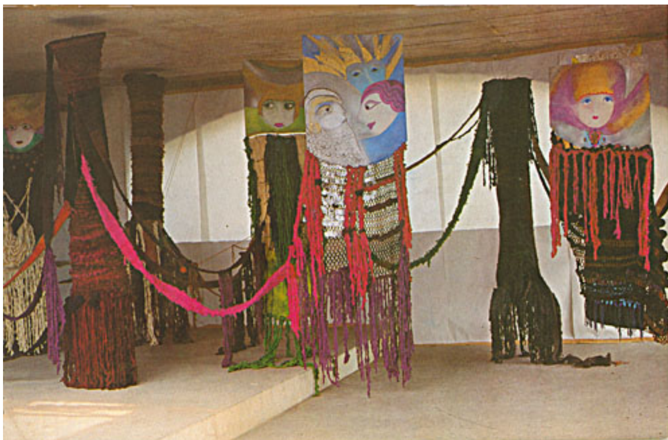
EL SECRETO DE LOS SERES HUMANOS