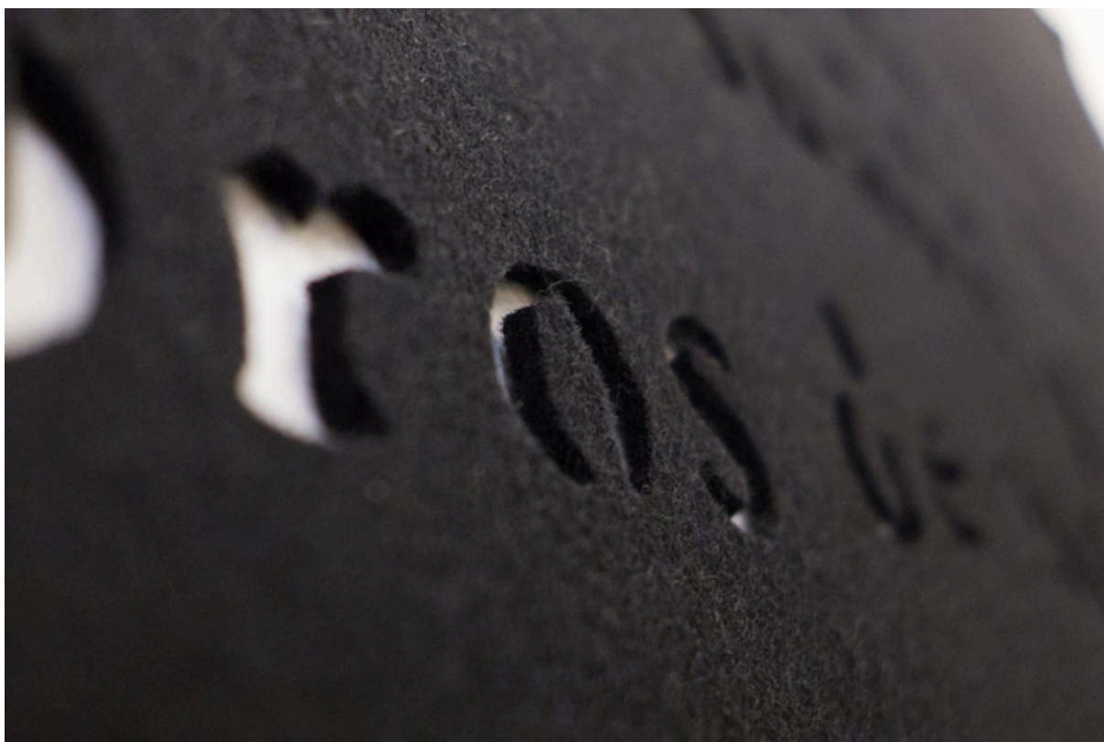
STILL LIFE/STYLE LEAF (detalle)