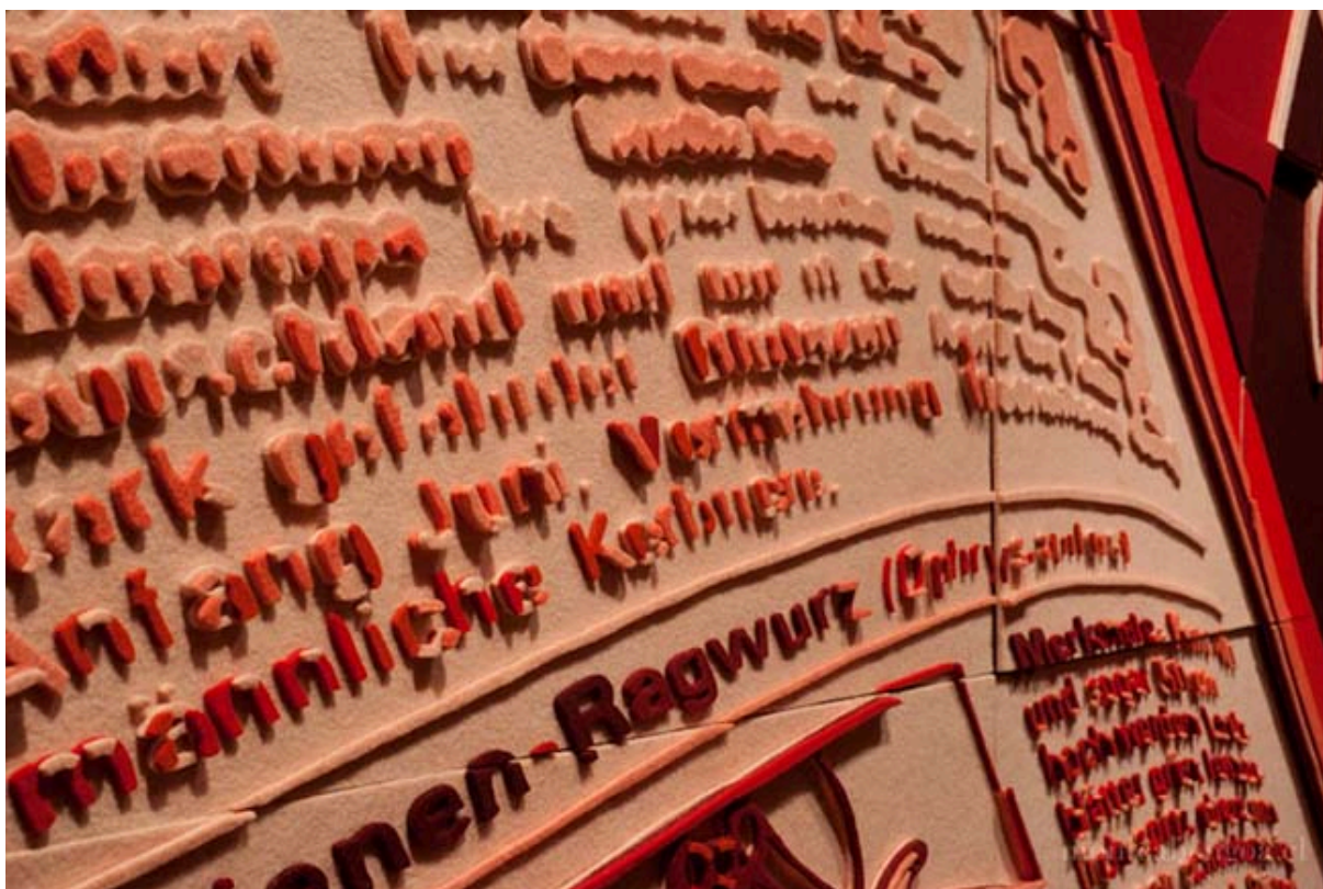
Einige Beobachtungen über Wildblumen: Bienen-Ragwurz ( Ophrys apifera ), detaille