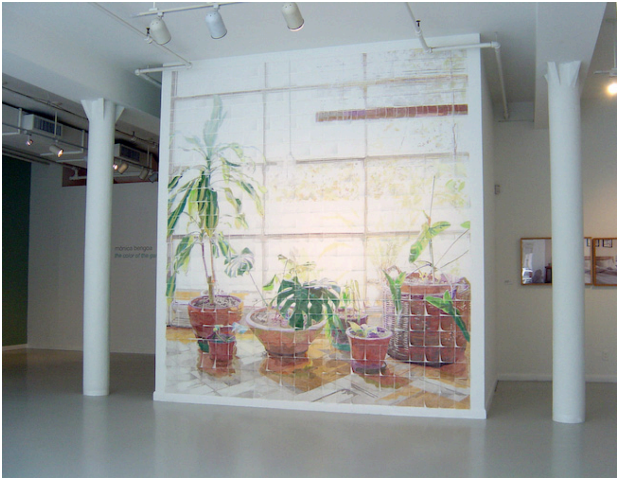
THE COLOR OF THE GARDEN (EL COLOR DEL JARDÍN)