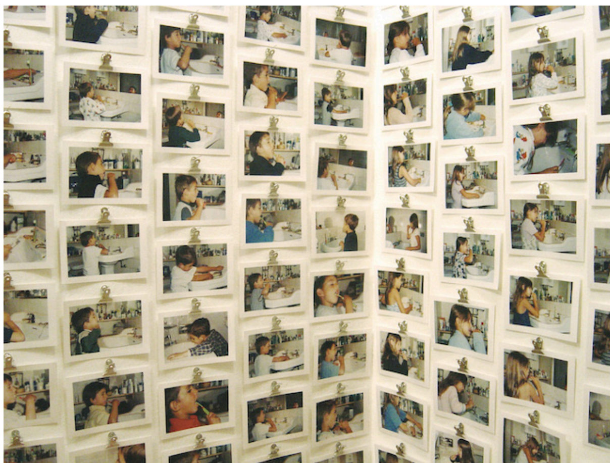
EN VIGILIA 4 (detalle)