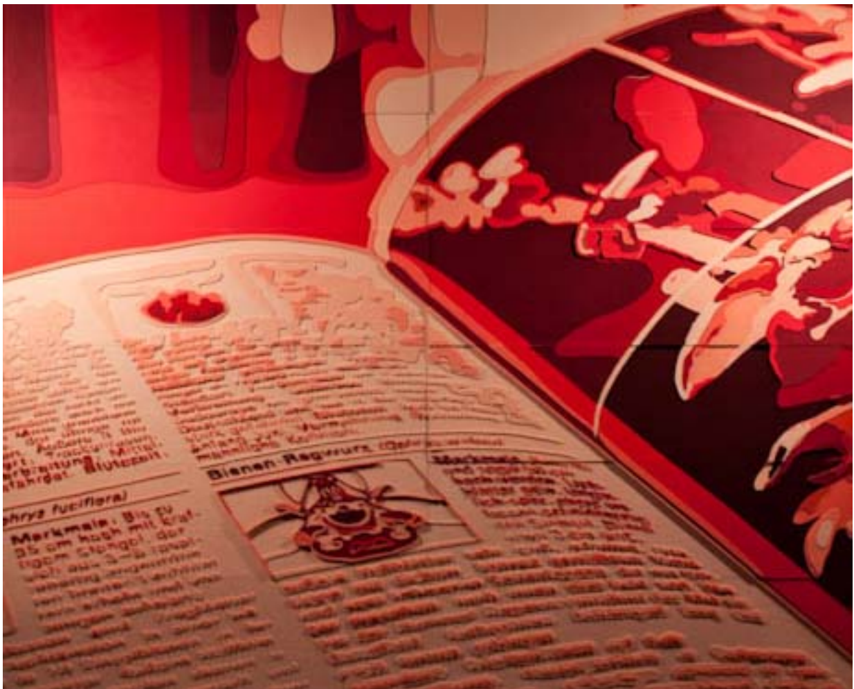
Einige Beobachtungen über Wildblumen: Bienen-Ragwurz ( Ophrys apifera )