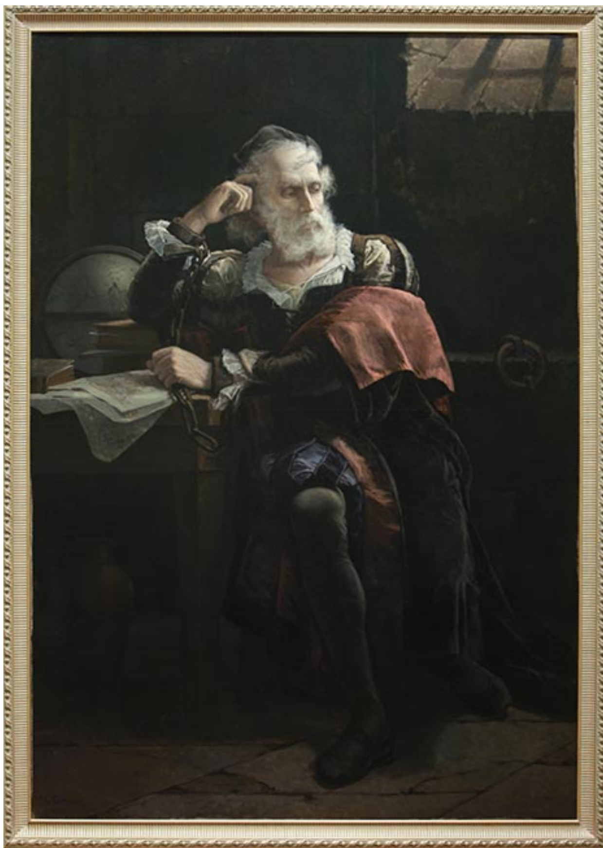
CRISTÓBAL COLÓN ENCADENADO