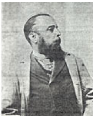
Pedro León Carmona