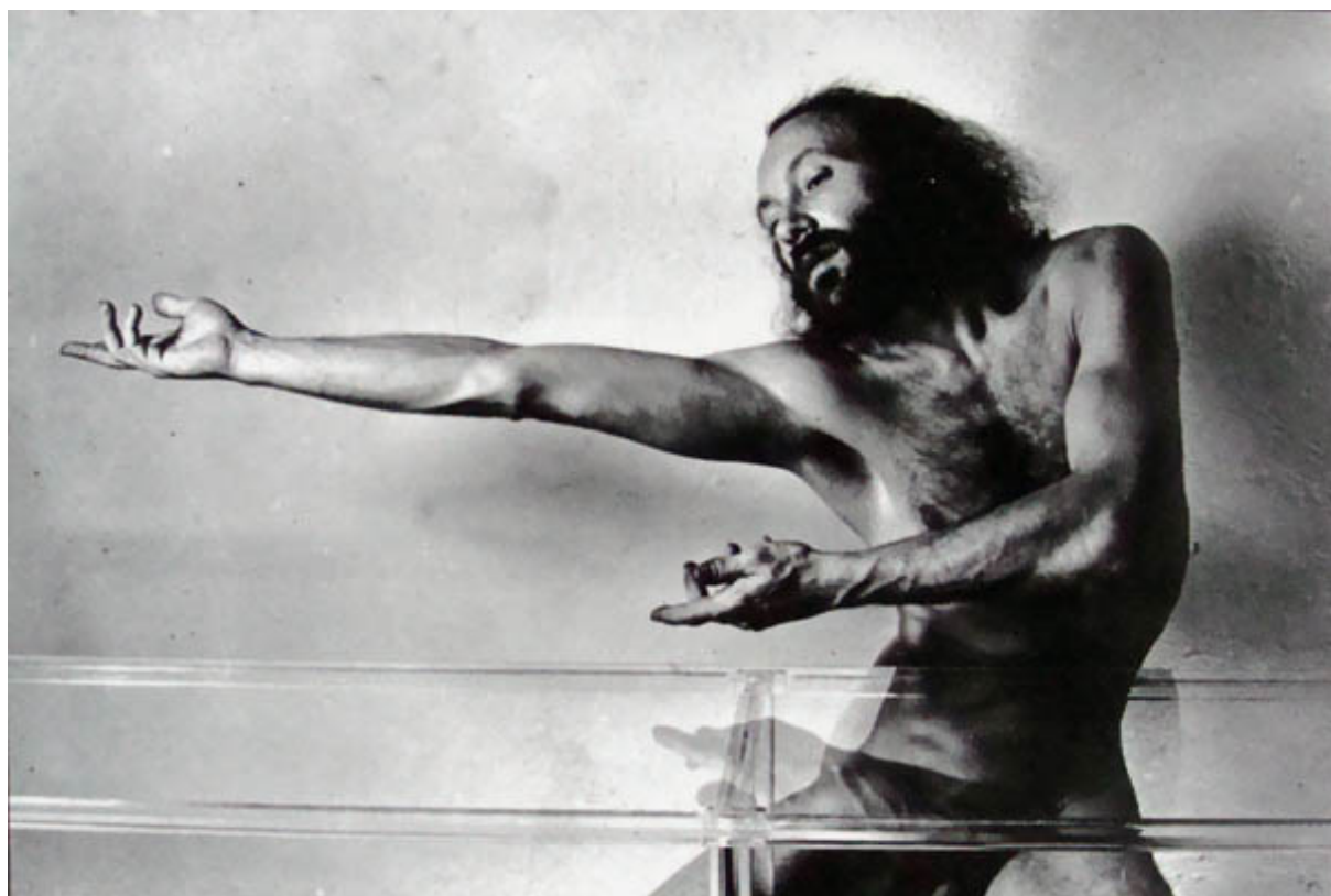
LA ÚLTIMA CENA (registro fotográfico de performance)