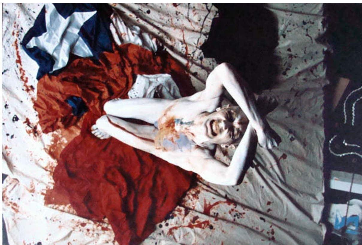
LA PARTIDA (registro fotográfico de performance)