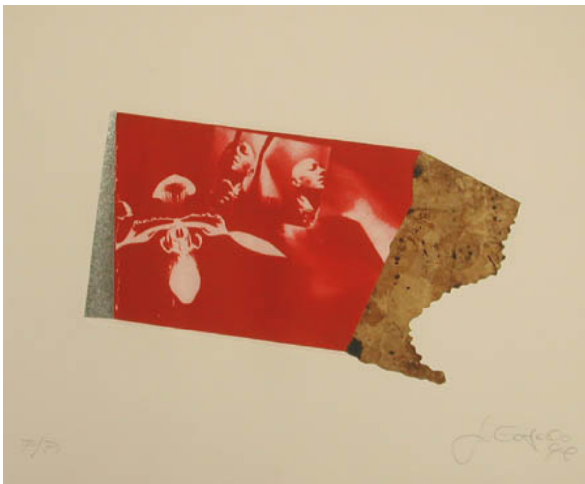
ORQUÍDEAS Y VOLCANES