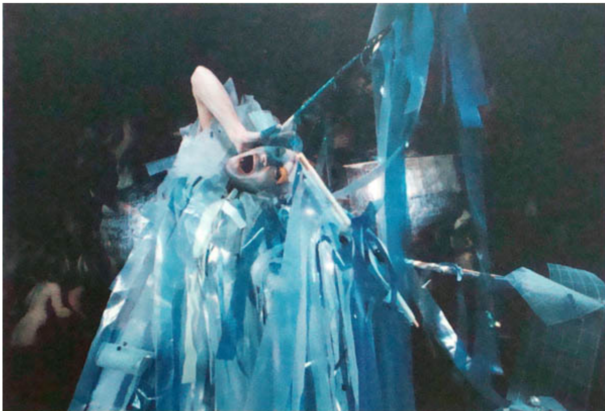
FIGURE D'ACQUA (registro fotográfico de performance)