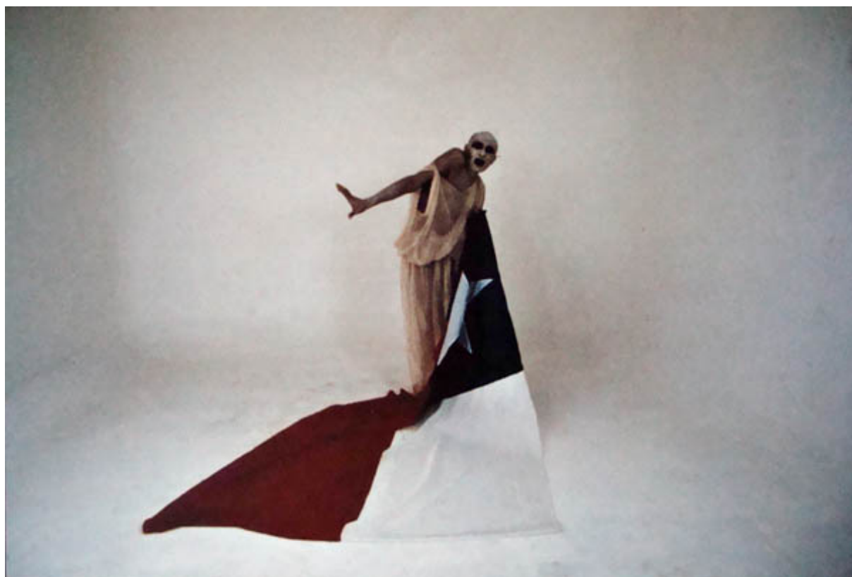
EL MIMO Y LA BANDERA (registro fotográfico de performance)