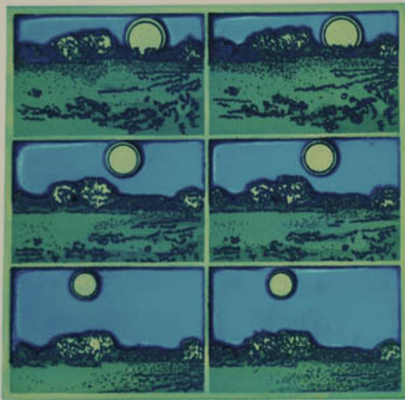
FASES DE LA LUNA