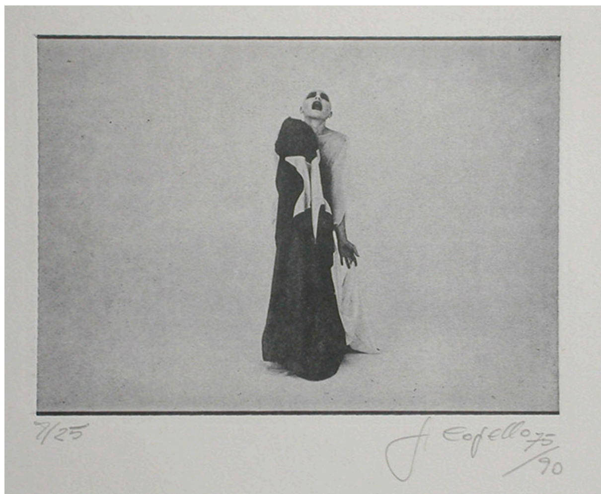
EL MIMO Y LA BANDERA