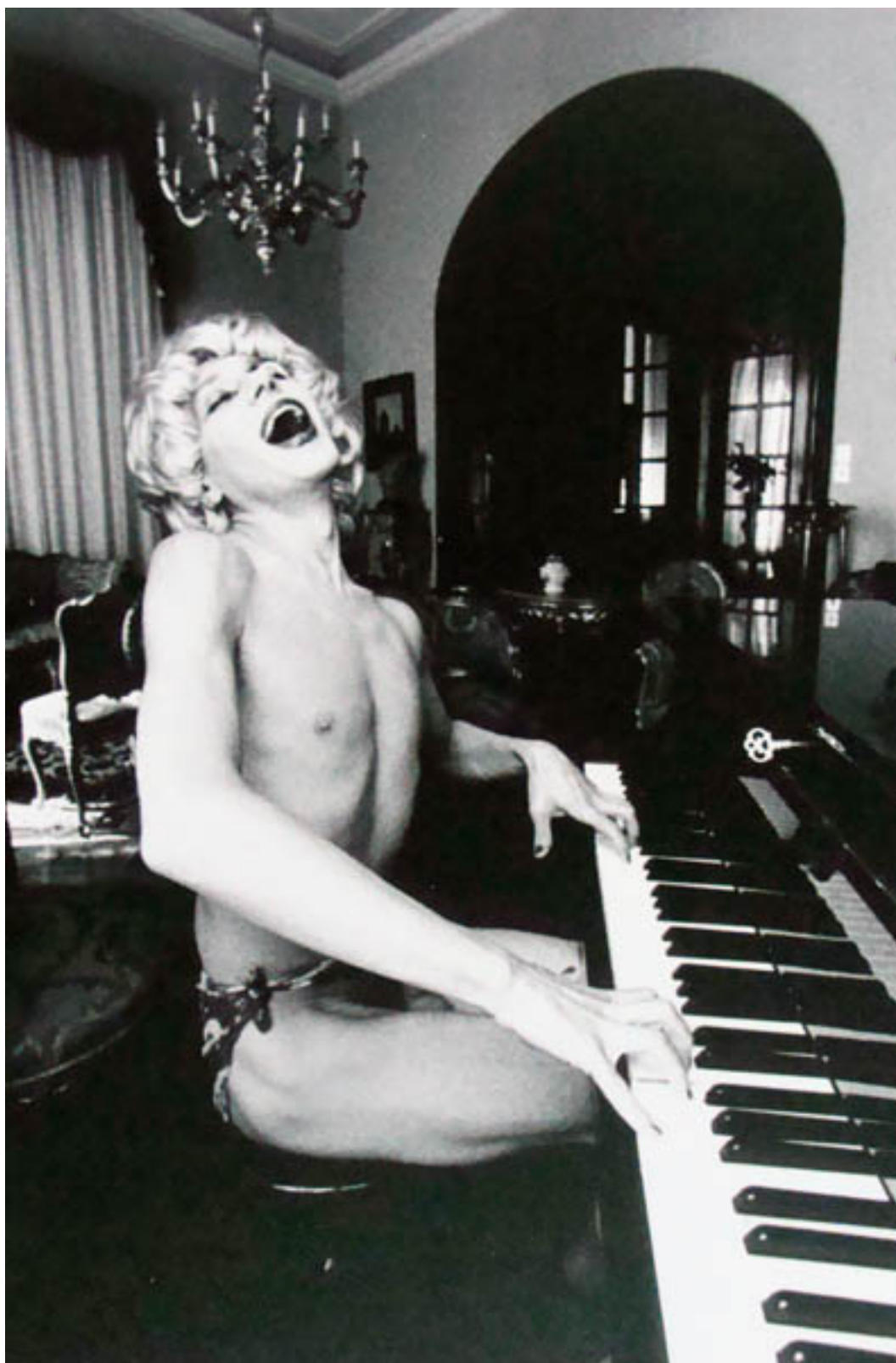
LANA TURNER (registro fotográfico de performance)