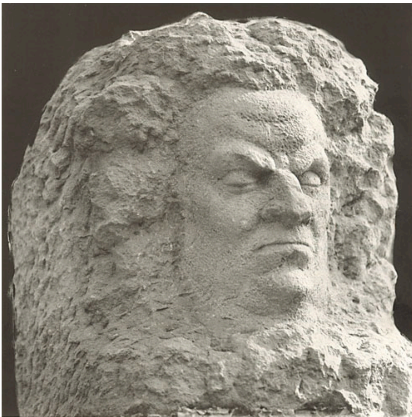
CABEZA DE AUGUSTO D'HALMAR