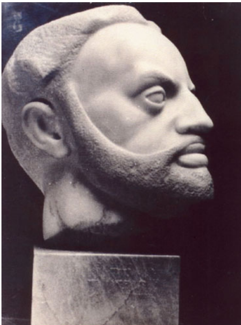
MONUMENTO A CALVO MAQUENA