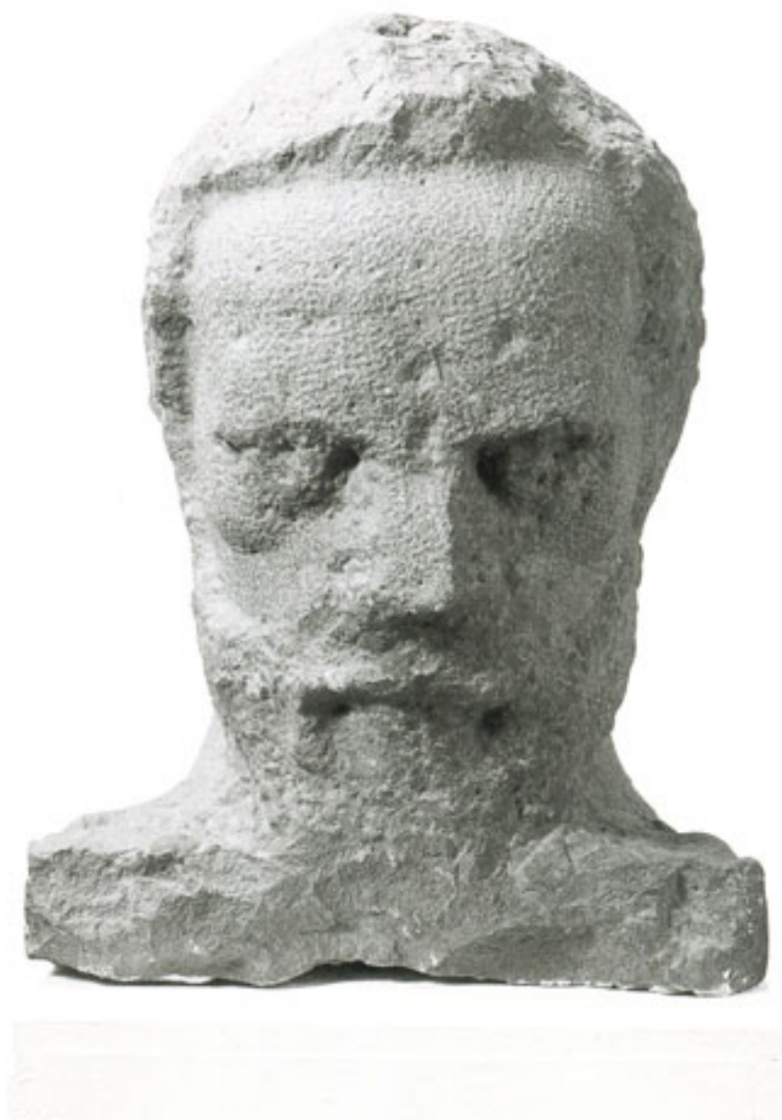
JUAN SEBASTIÁN BACH