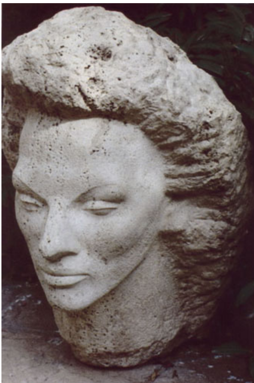
CABEZA ESTUDIO PARA MONUMENTO A CATAL

BIBLIOTECA/MNBA. Colección de Artículos de Prensa del Artista LORENZO DOMÍNGUEZ publicados en los diarios y revistas entre 1930-2010.