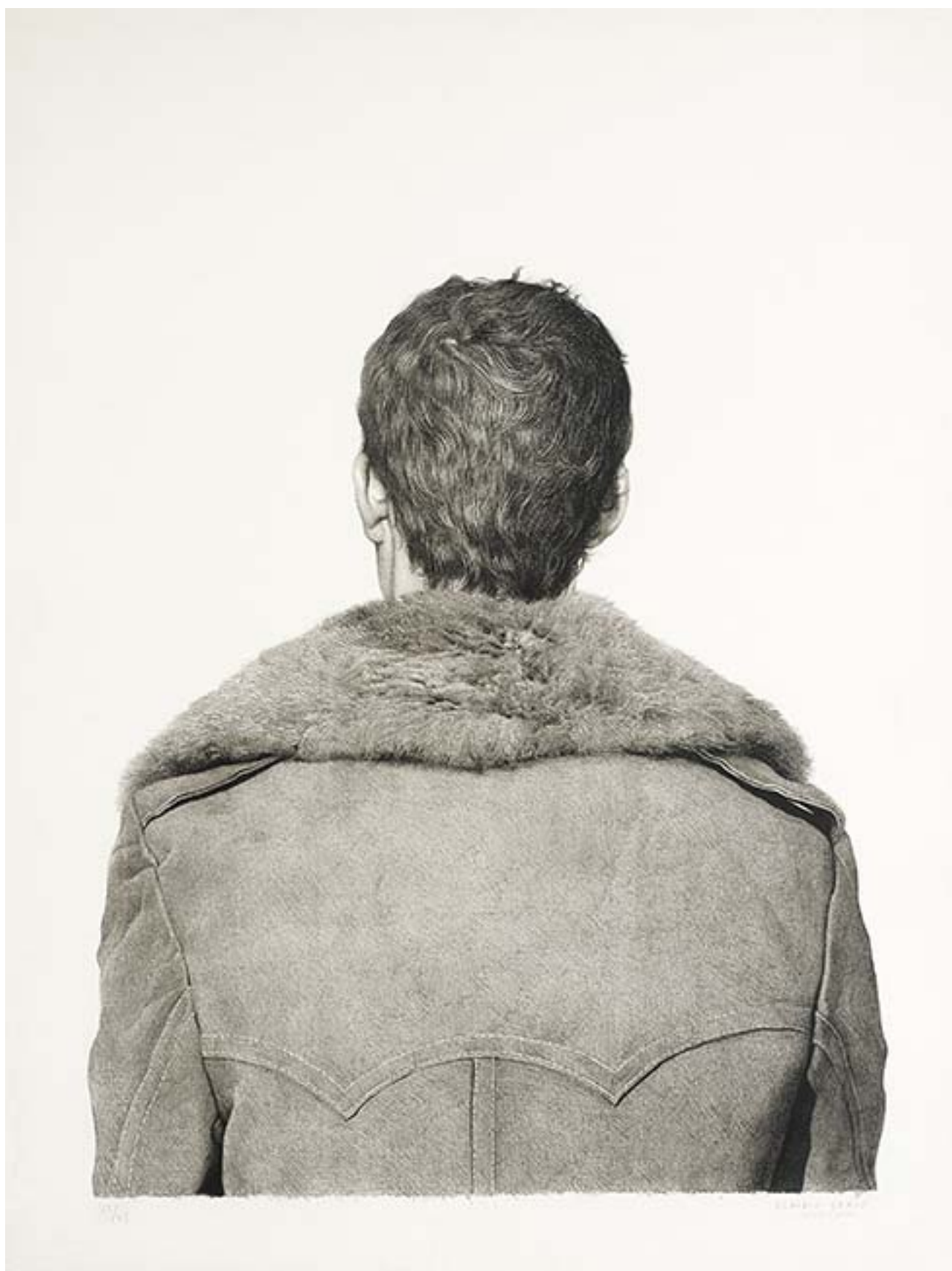
ABRIGO DE PIEL, REVERSO