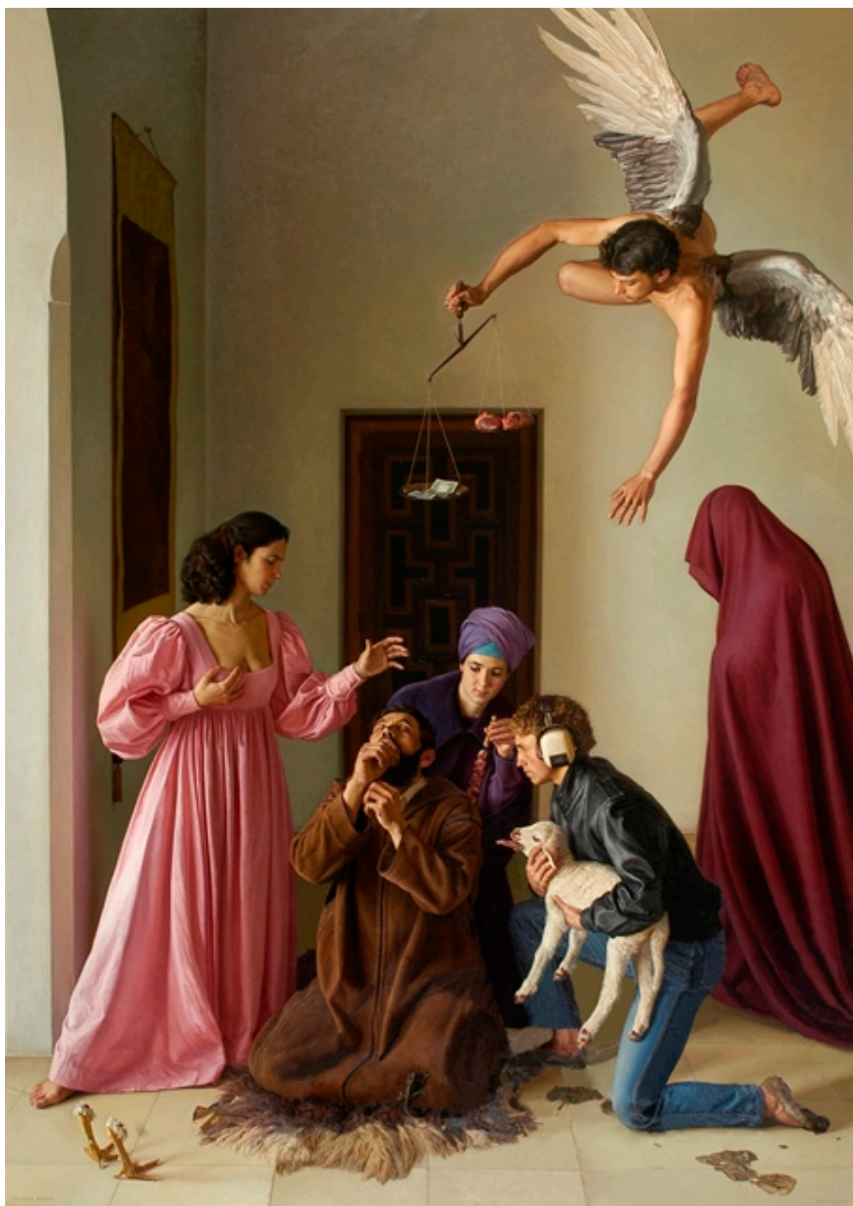
Tentación de San Antonio