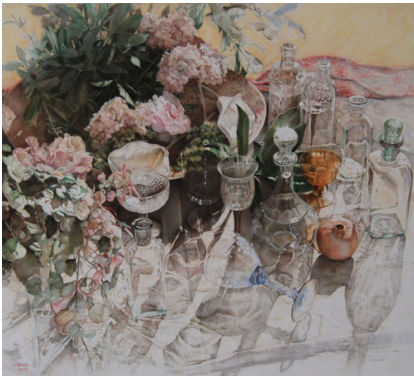
RAMO Y CRISTALES