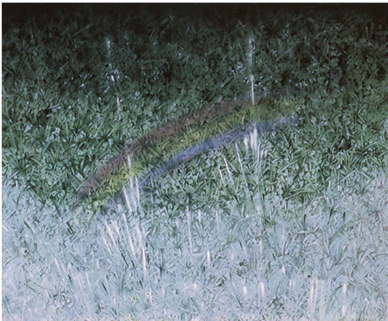
BARROCO ARCOIRIS SOBRE CÉSPED