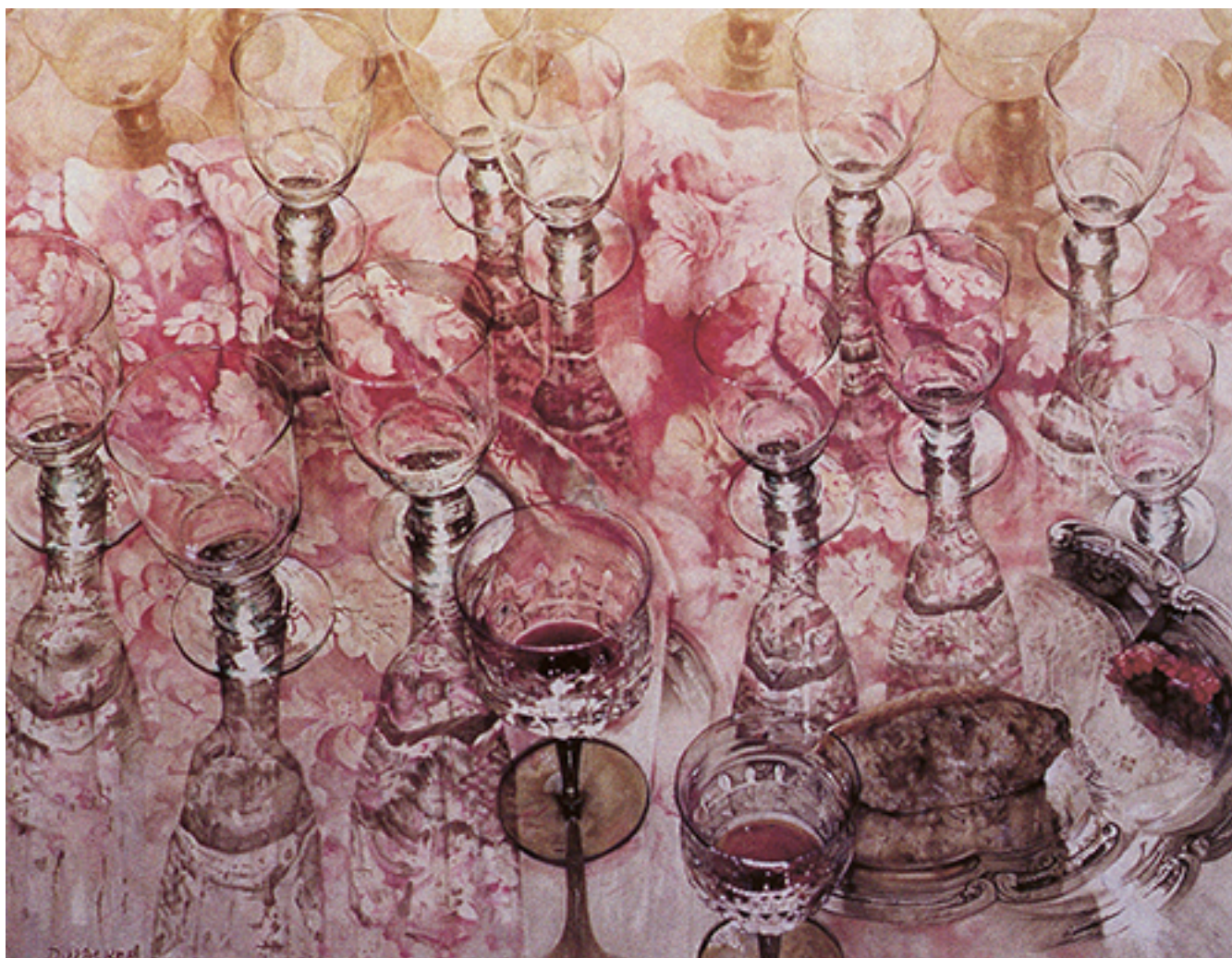
BARROCO: COPAS AMARILLAS Y BLANCAS