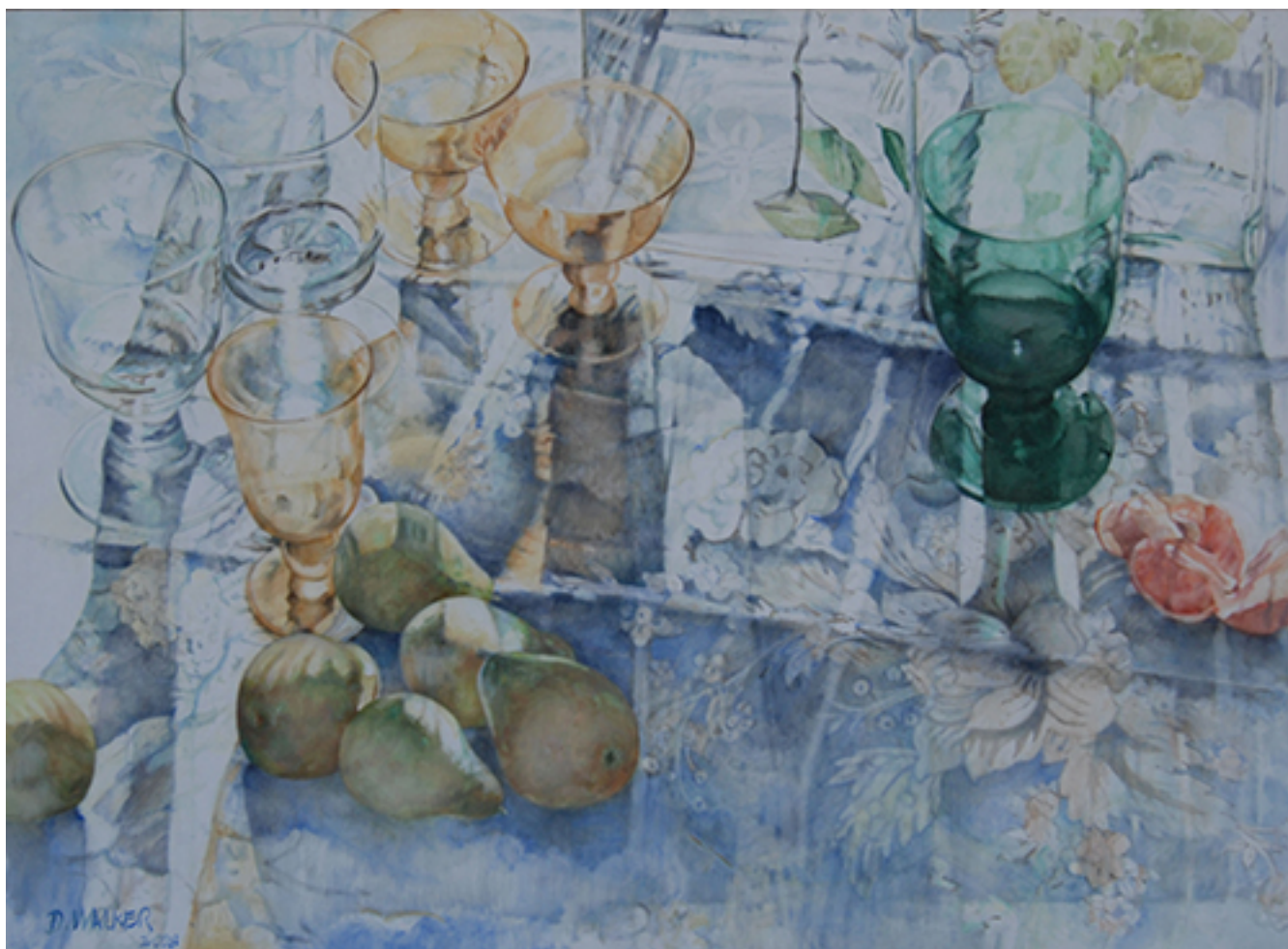
PERLAS Y CRISTALES