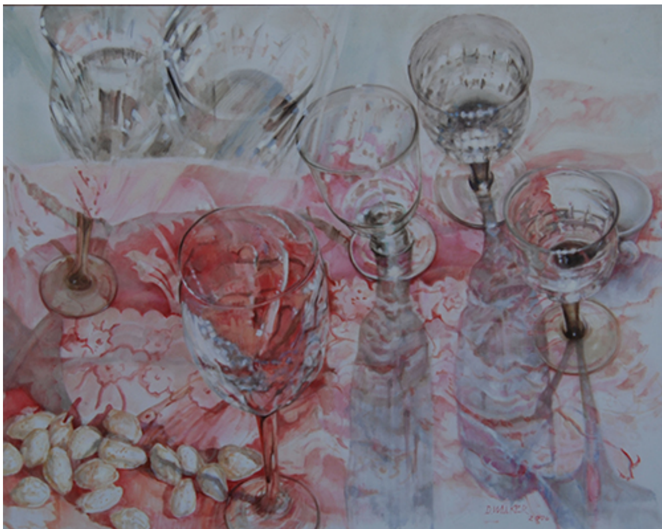
BARROCO COPAS ROJAS