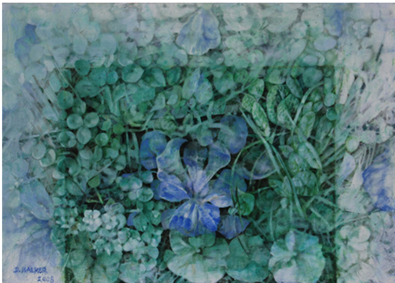
BARROCO: BLOQUE DE CÉSPED OSCURO EN MOVIMIENTO