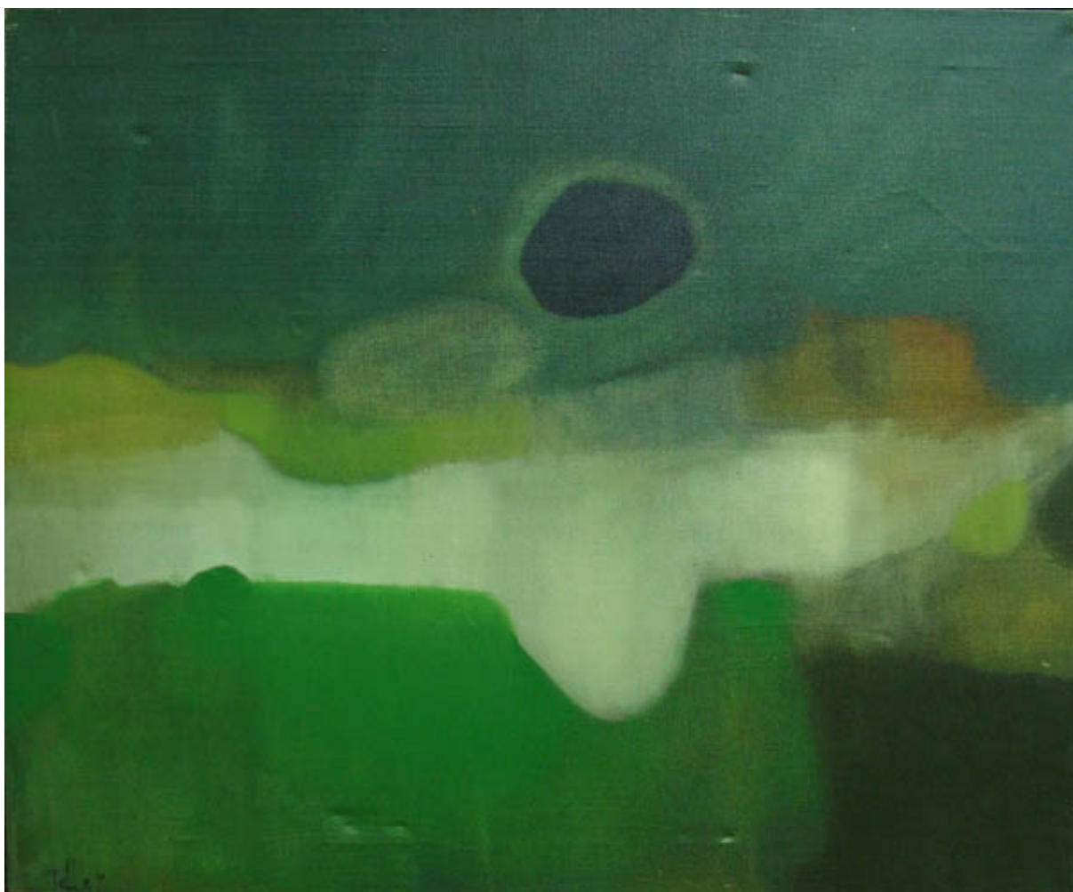
PAISAJE CON LUNA NEGRA