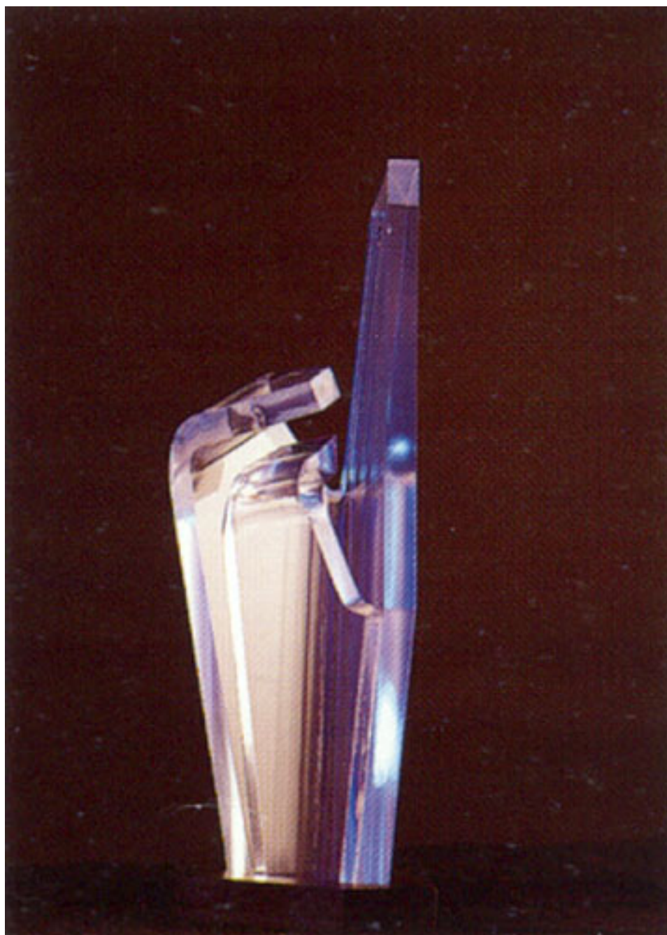
PROYECCIÓN CÓSMICA EJERCICIO N°7