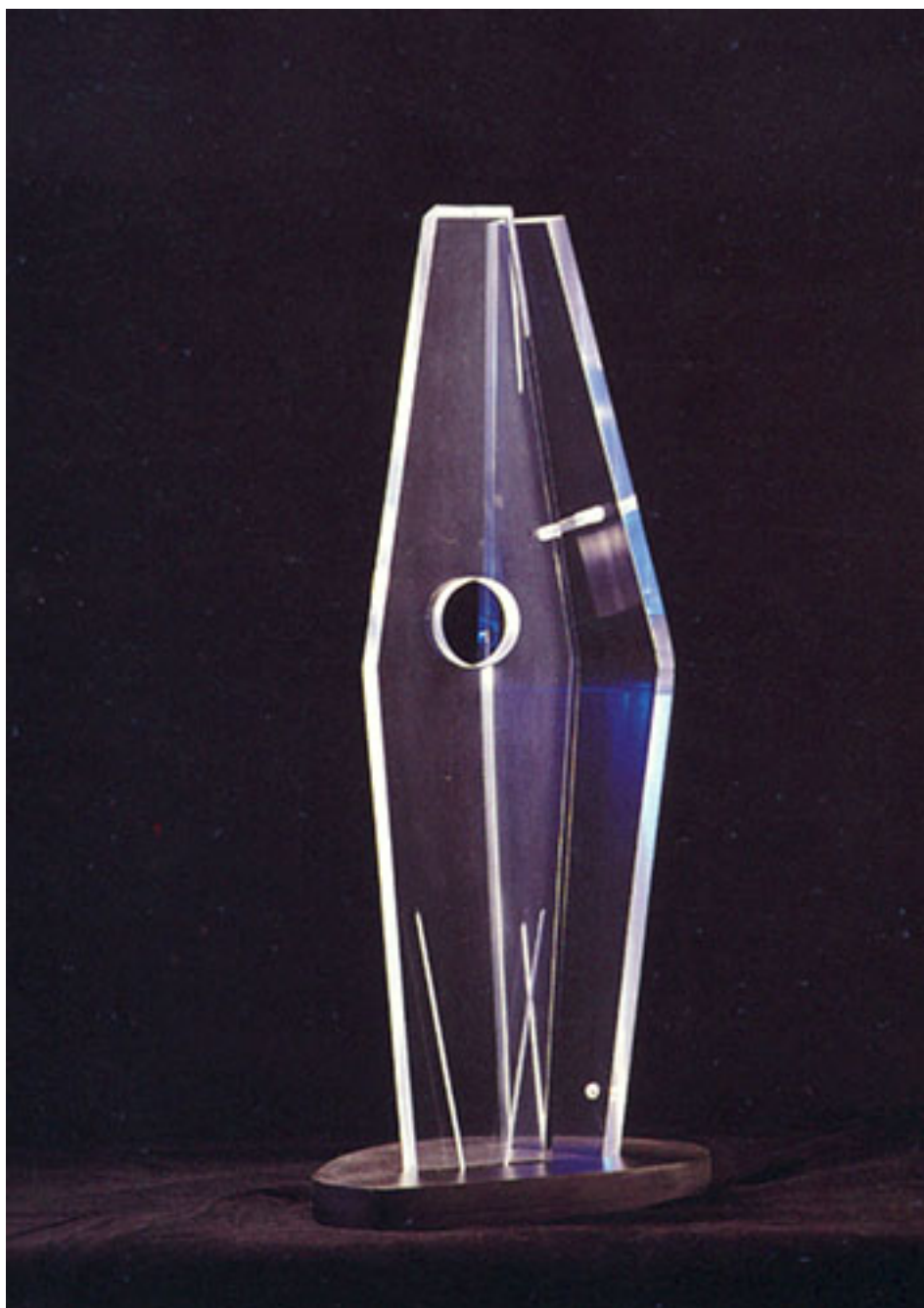
PROYECCIÓN CÓSMICA EJERCICIO N°8