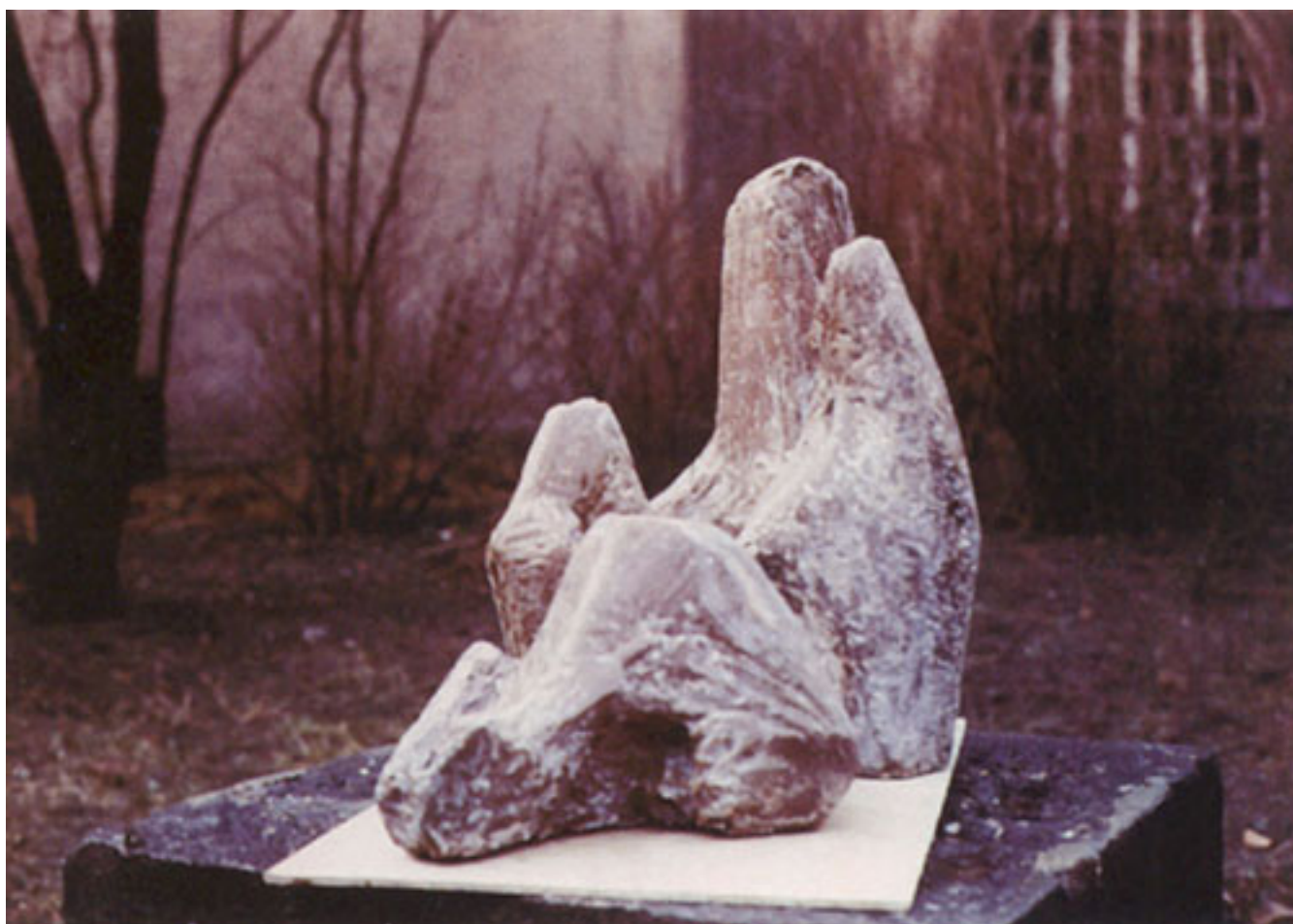
LOS MUERTOS Y LOS VIVOS