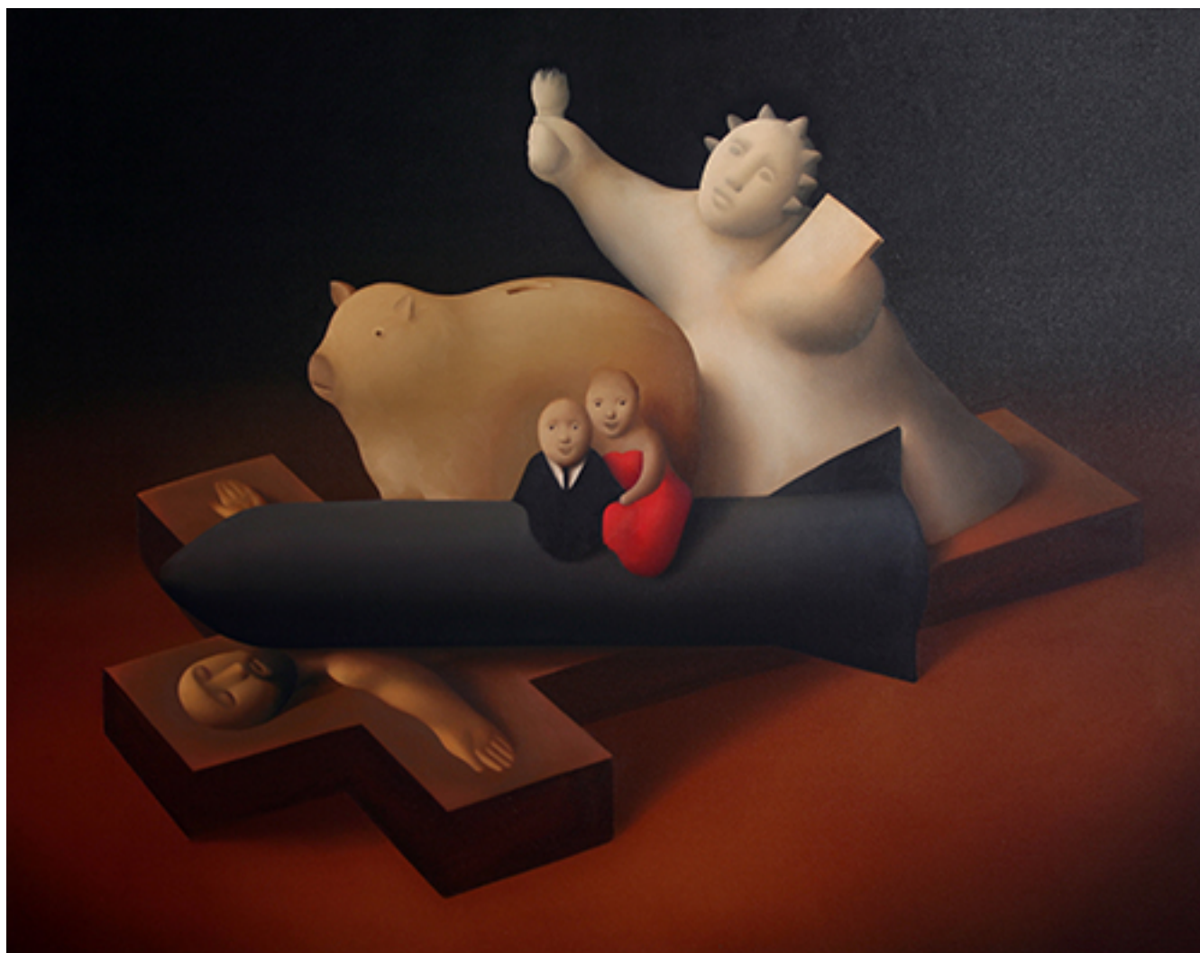
EL TRIUNFO DE LA BUENA APARIENCIA