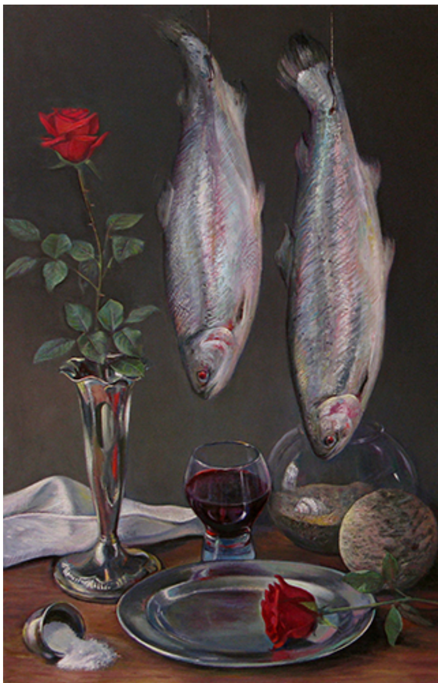
EL CORAZÓN DE LAS COSAS