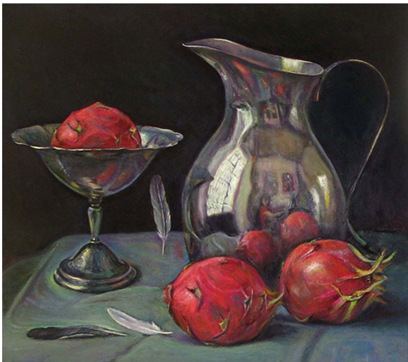
AUTORRETRATO CON PITAHAYAS