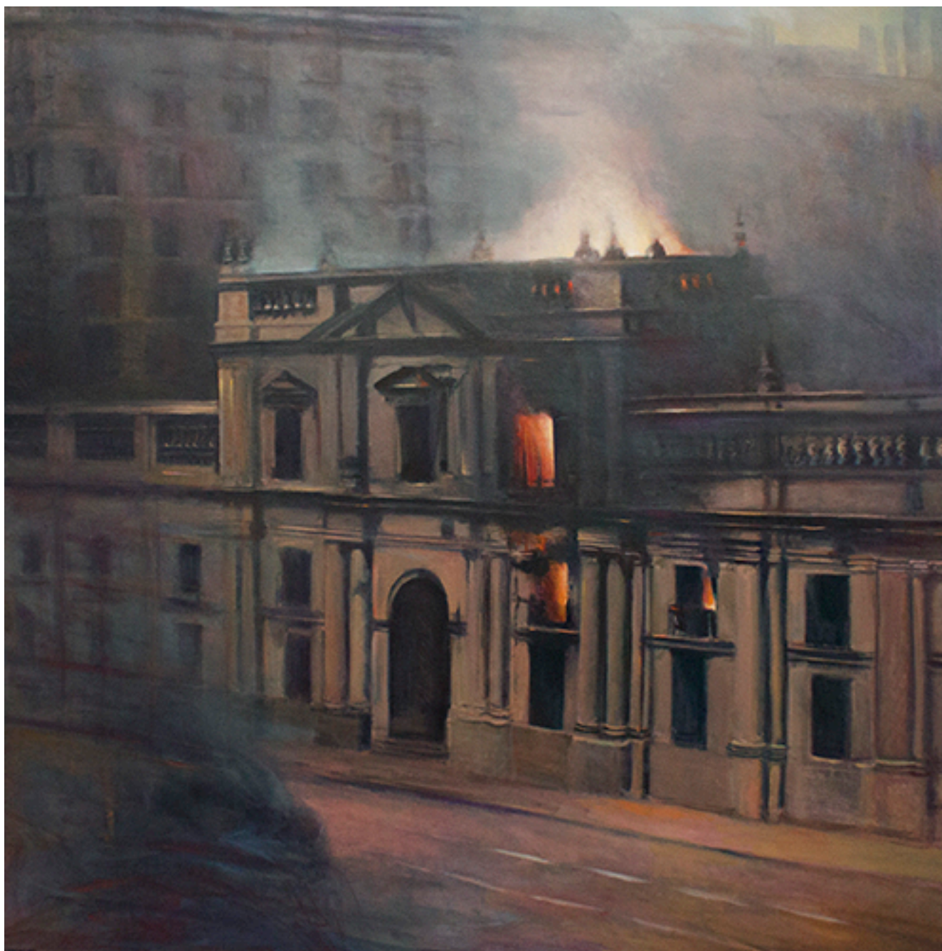
LA MONEDA EN LLAMAS