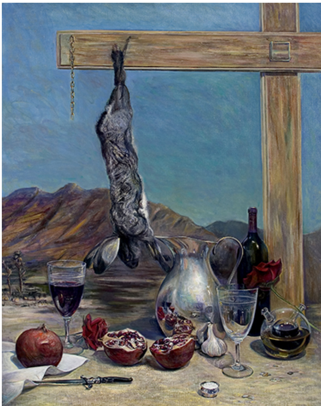
LA DIÁFANA MIRADA