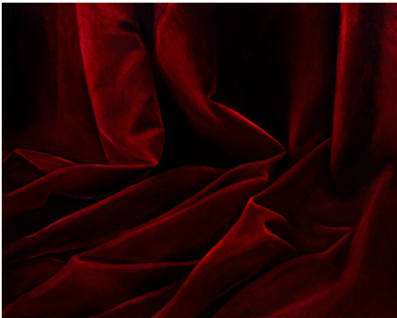
BODAS DE SANGRE