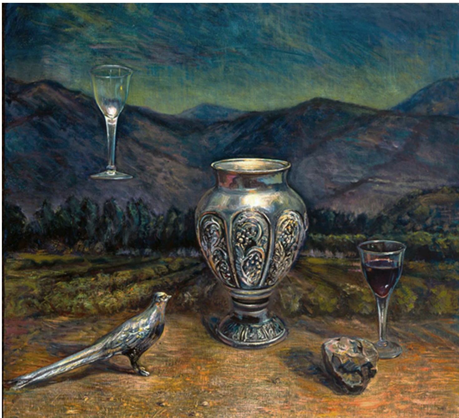
LA SAVIA INMENZA