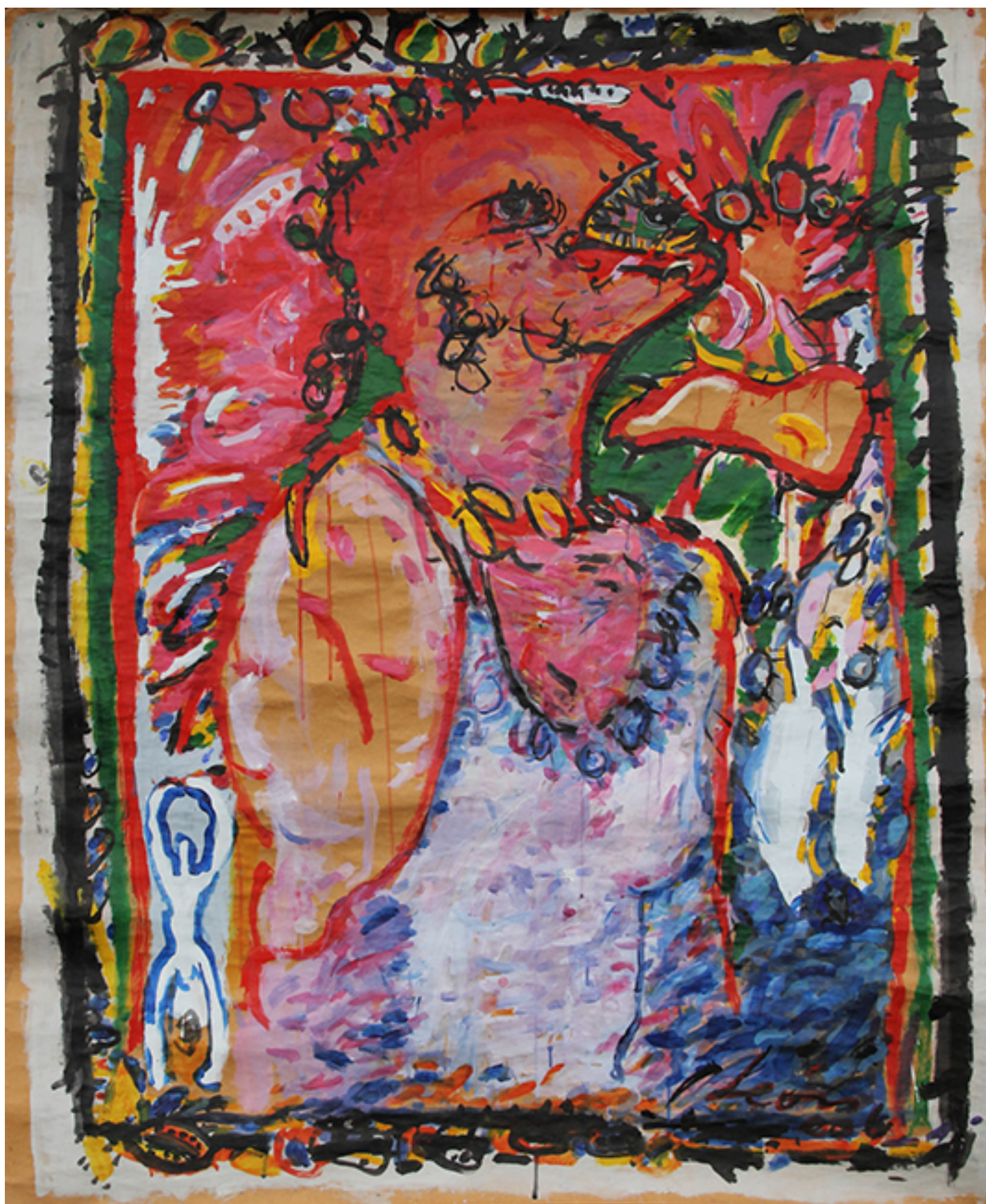
COMEDORA DE ERIZOS