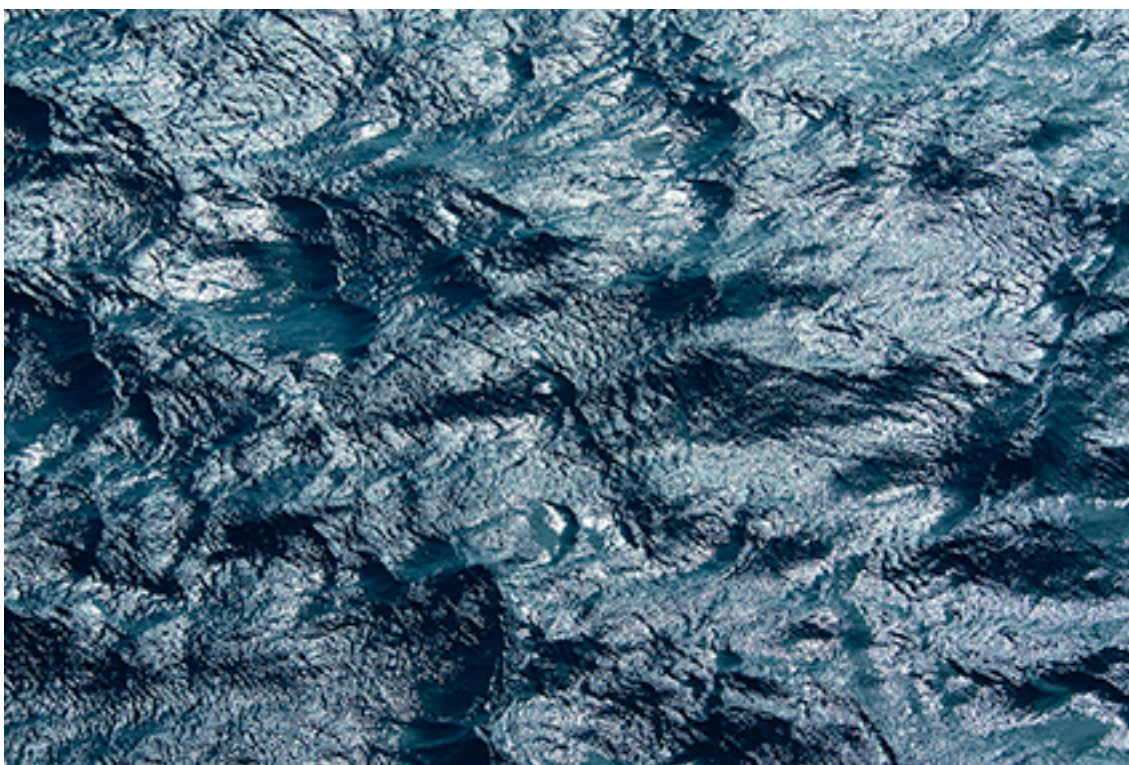
14:05:49 WATER 12 FROM THE SERIES OCEANS