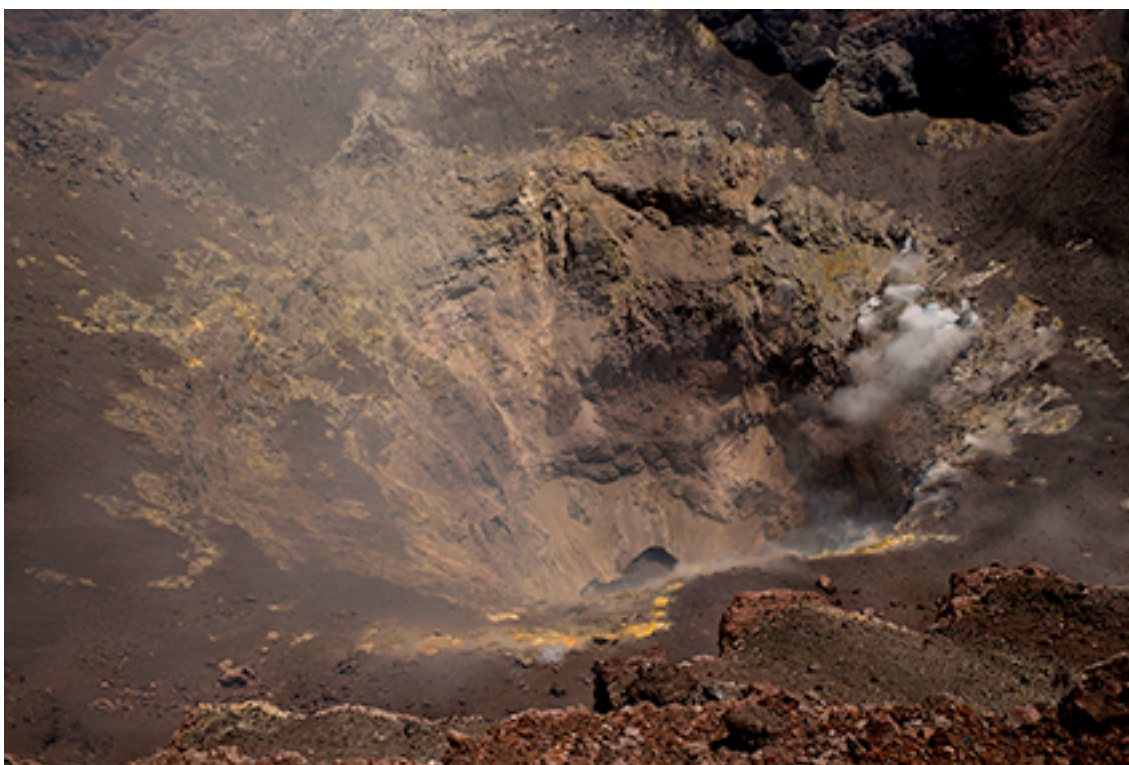
12:02:18 DESERT 101 FROM THE SERIES DESERT