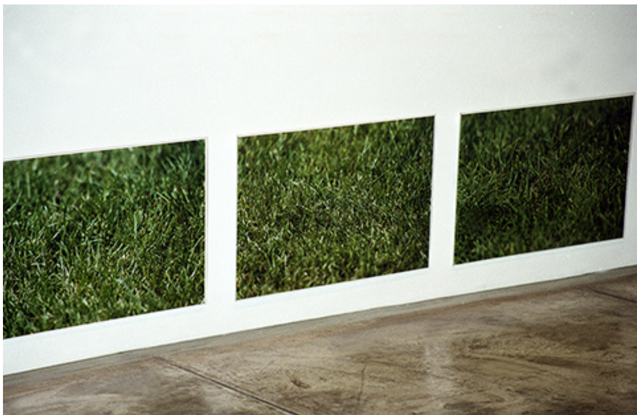
CHEPICA BERMUDA 090 FROM THE INSTALLATION CHEPICA BERMUDA