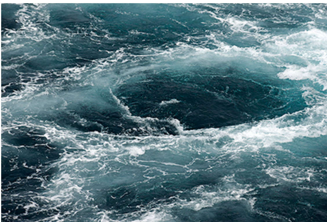
11:26:10 WATER 84 FROM THE SERIES OCEANS