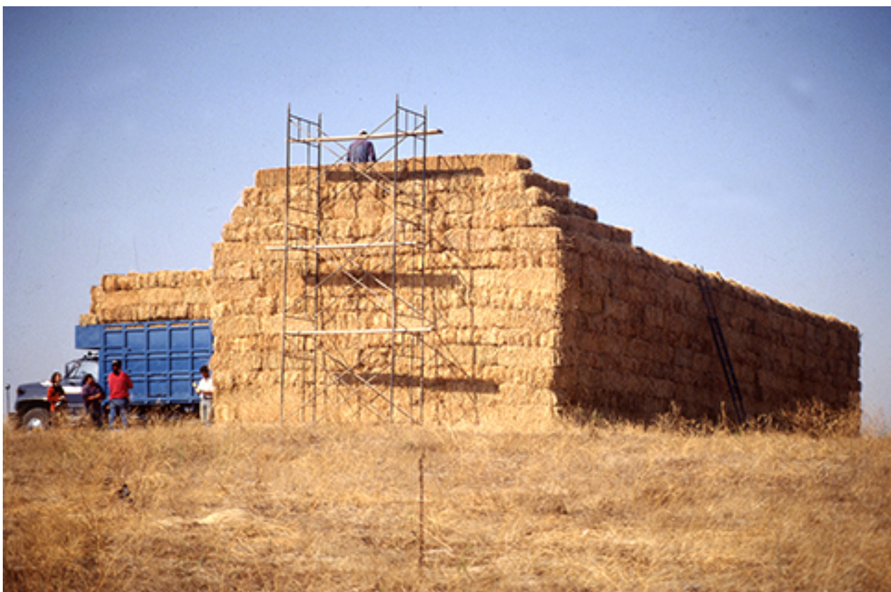
STRAW HOUSE 089 FROM DE INSTALLATION STRAW HOUSE