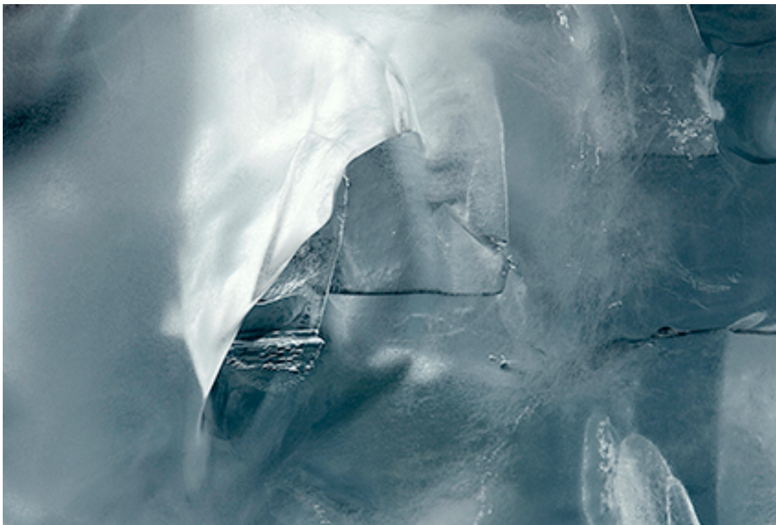
10:06:54 ICE 24 FROM THE SERIES GLACIERS