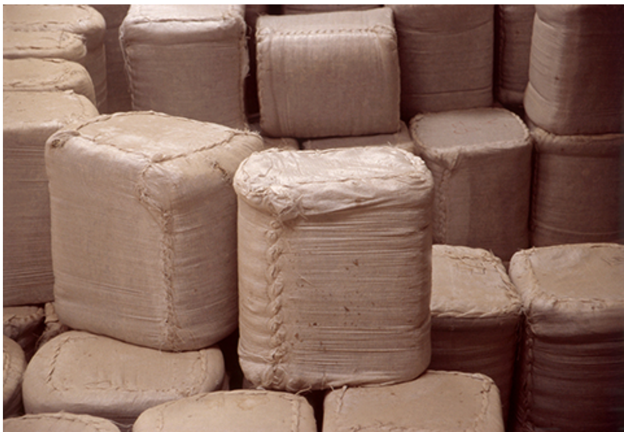
BOLDOS 01 FROM THE INSTALLATION NICTAGENIAS