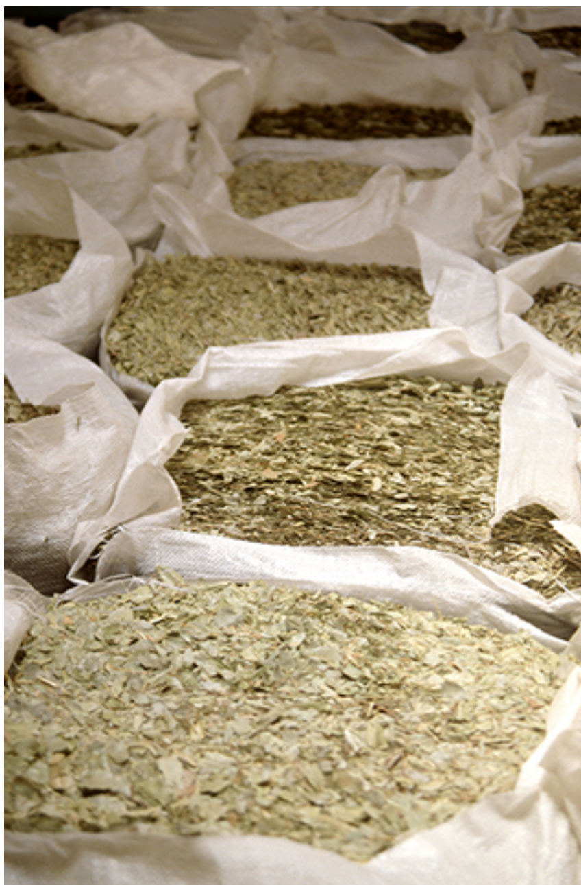
BOLDOS 03 FROM THE INSTALLATION NICTAGENIAS