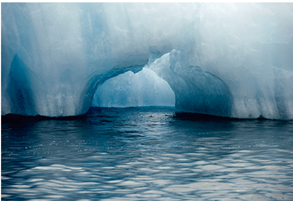
10:20:30 ICE 30 FROM THE SERIES GLACIERS