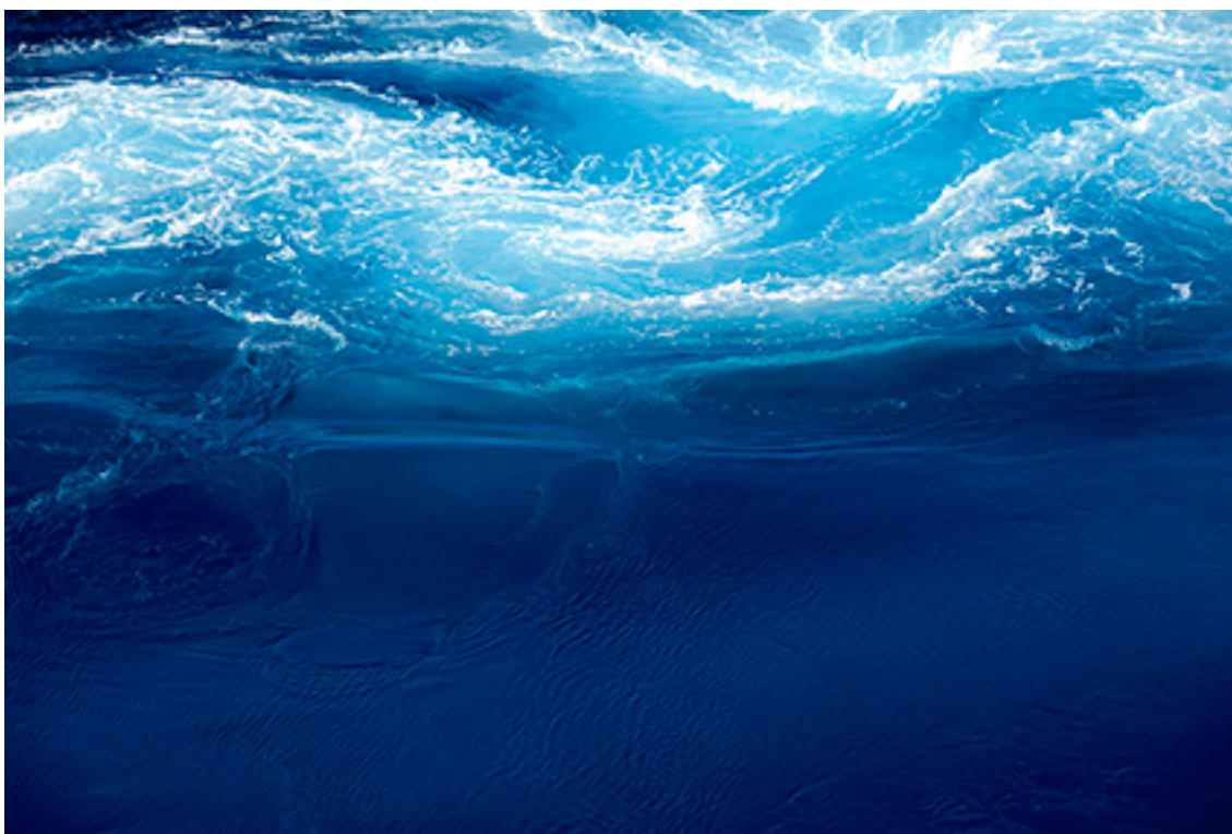
14:05:10 WATER 06 FROM THE SERIES OCEANS