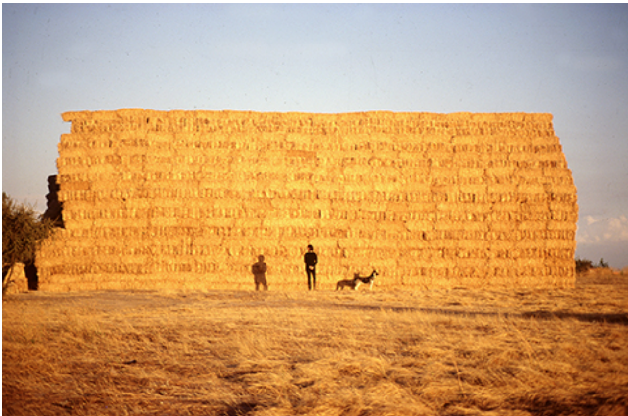
STRAW HOUSE 079 FROM DE INSTALLATION STRAW HOUSE

MUSEO DE SANTIAGO CASA COLORADA, 2000. Cotidiano: ciclo de instalaciones . Santiago de Chile: Museo de Santiago Casa Colorada.