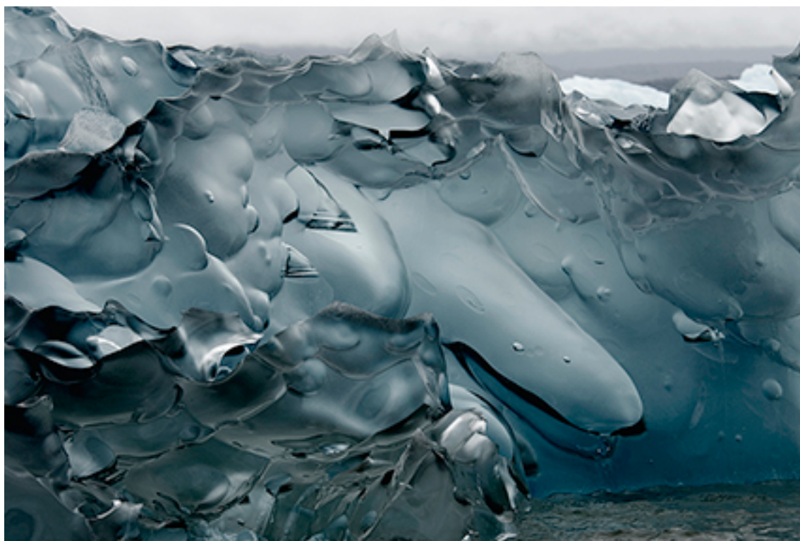
10:22:50 ICE 11 FROM THE SERIES GLACIERS