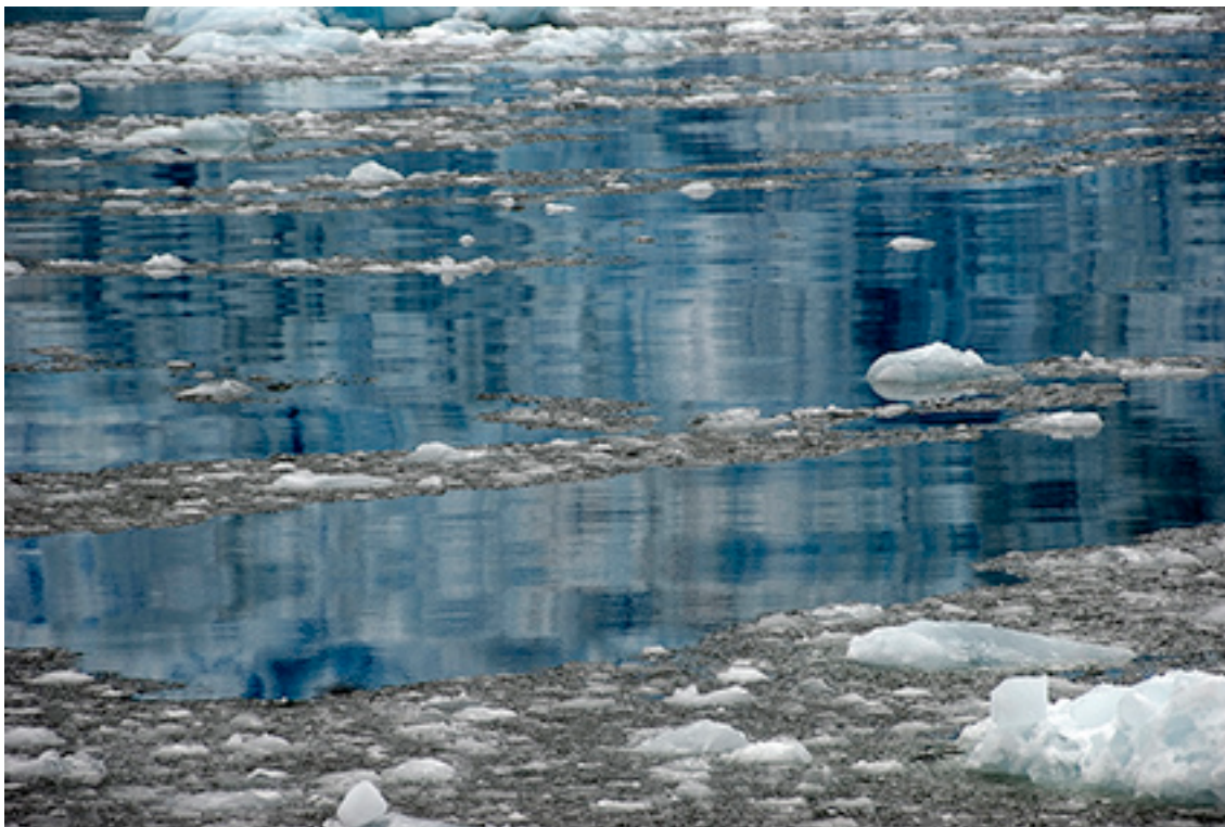
12:51:31 WATER 02 FROM THE SERIES GLACIERS