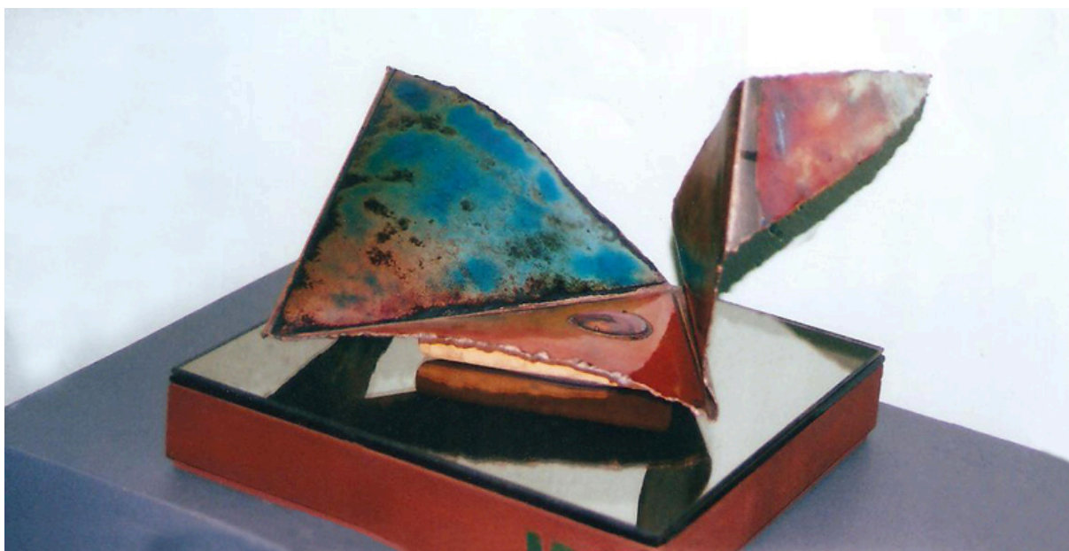
REFLEJOS, de la serie VUELOS ANDINOS