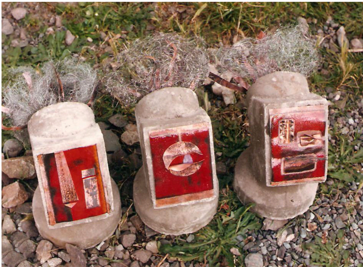
INSTALACIÓN SILENCIO (detalle sin columnas)